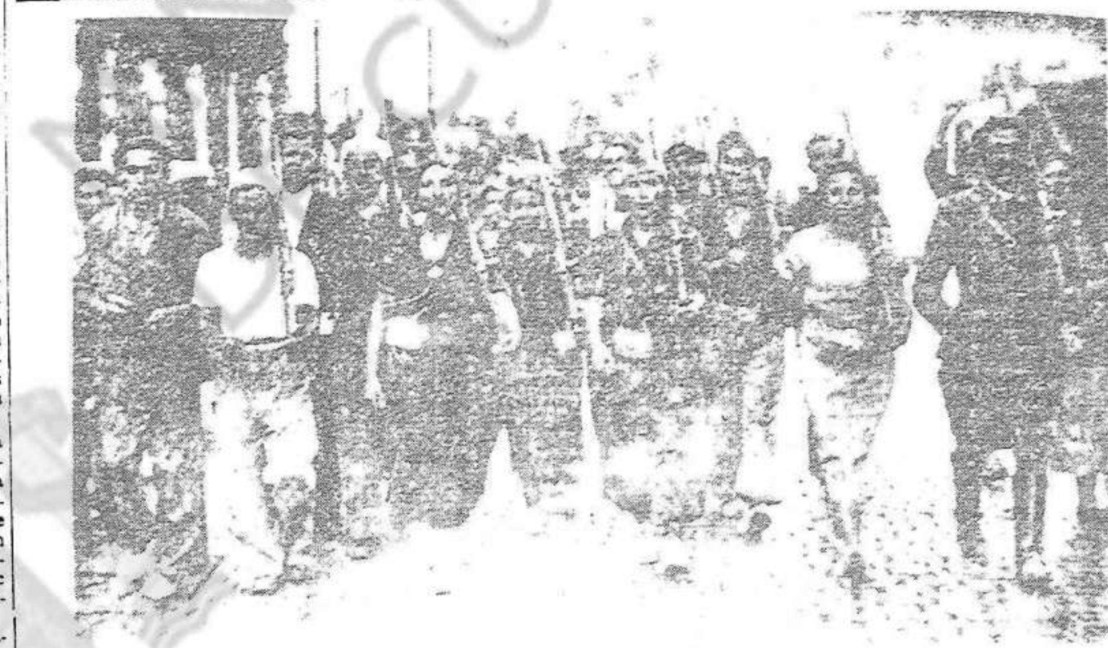
Homes i dones armats... Heus ací l'embrió d'un exèrcit veritablement popular. Els seus pits són la terramànica que la oserna i la barbàrie no tindran mai més res a fer al nostre país.

L'Estat Major de la Revolució Al camp d'operacions arriben en un cotxe els nostres volguets camarades «Pasionaria» i José Díaz. El batalló rep amb un gran visca els dirigents del Partit