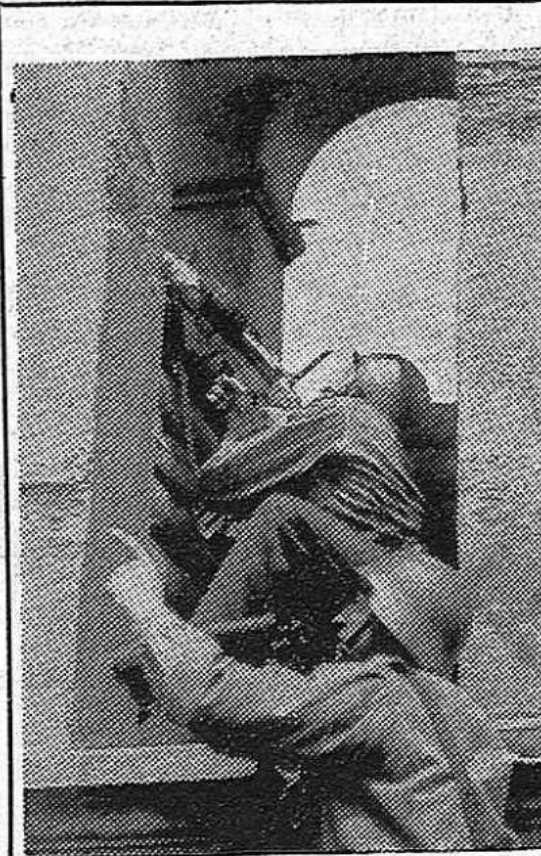
Con medios de fortuna se defiende Vizcaya contra los primeros ataques masivos de la aviación germano-italiana. Mientras tanto, la política de no intervención, llevada adelante por los imperialistas y sus lacayos, impedía la ayuda a la República española.