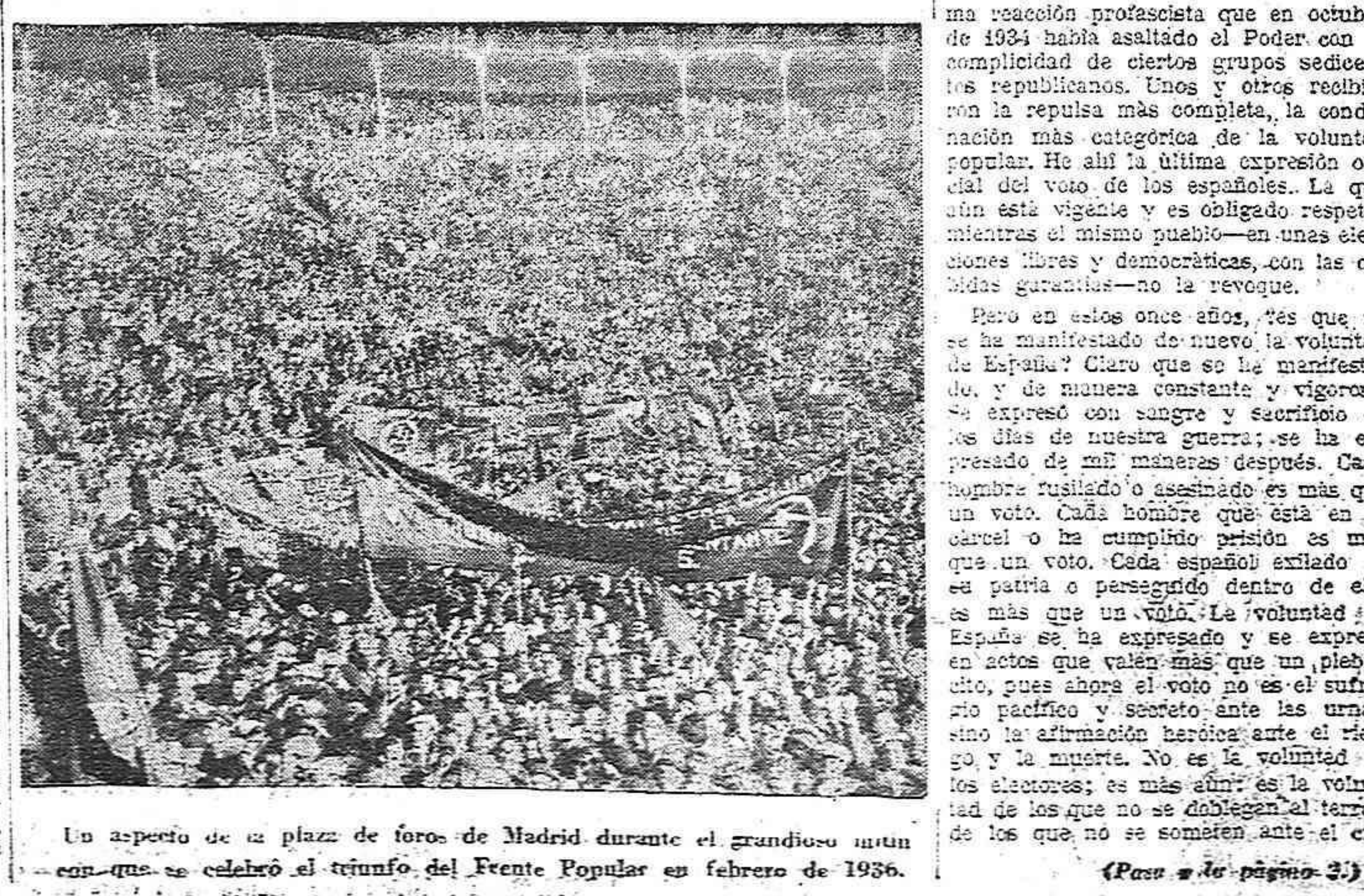
Un aspecto de la plaza de toros de Madrid durante el grandioso mitin que se celebró el triunfo del Frente Popular en febrero de 1936.