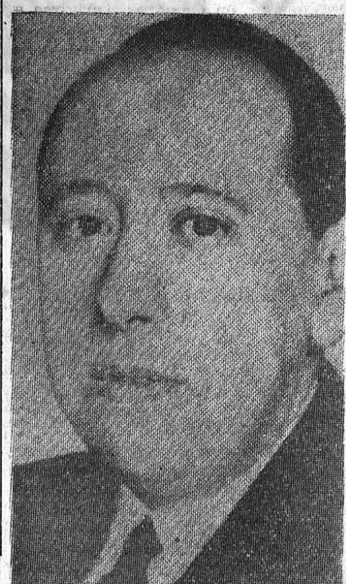
El Sr. Gil Robles, en el que confían los monárquicos.