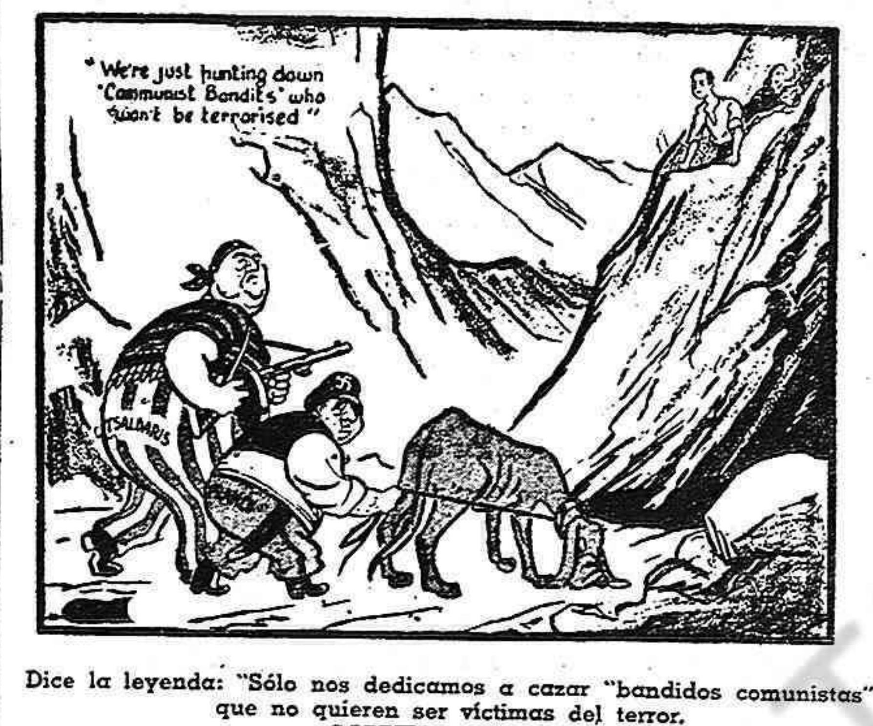
Dice la leyenda: "Solo nos dedicamos a cazar 'bandidos comunistas' que no quieren ser víctimas del terror." GABRIEL, en "Daily Worker", de Londres.