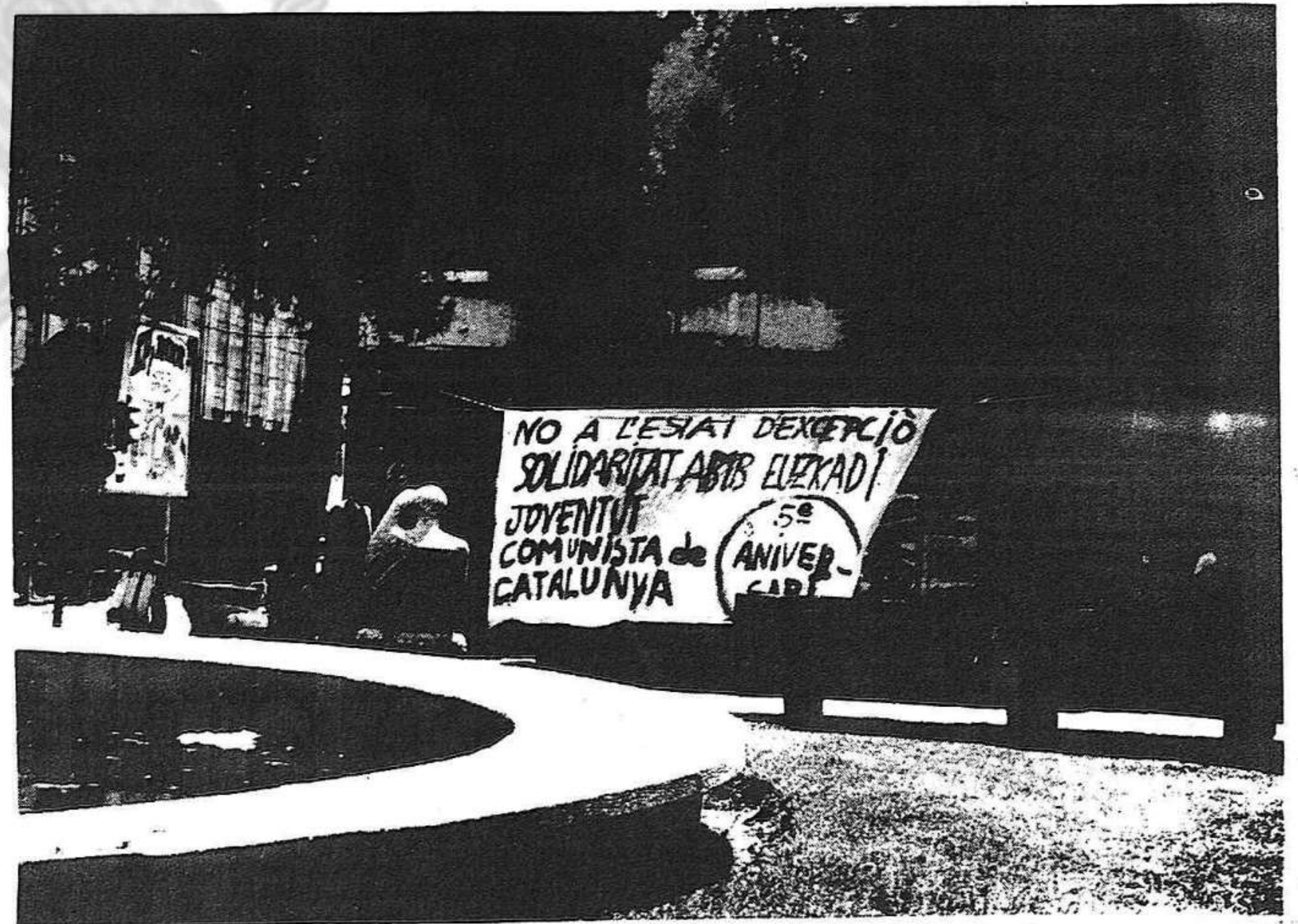
Pancarta posada a Sabadell, el primer de juliol, per la J.C.

Les vacances no han de ser un obstacle perquè tots participem a la mobilització massiva contra el crim. Fins i tot des dels llocs de repòs, una allau de telegrams, escrits i resolucions, de manifestacions, ha d'expressar el sentiment unànim d'oposar-se a l'execució de Garmendia i Otaegui.