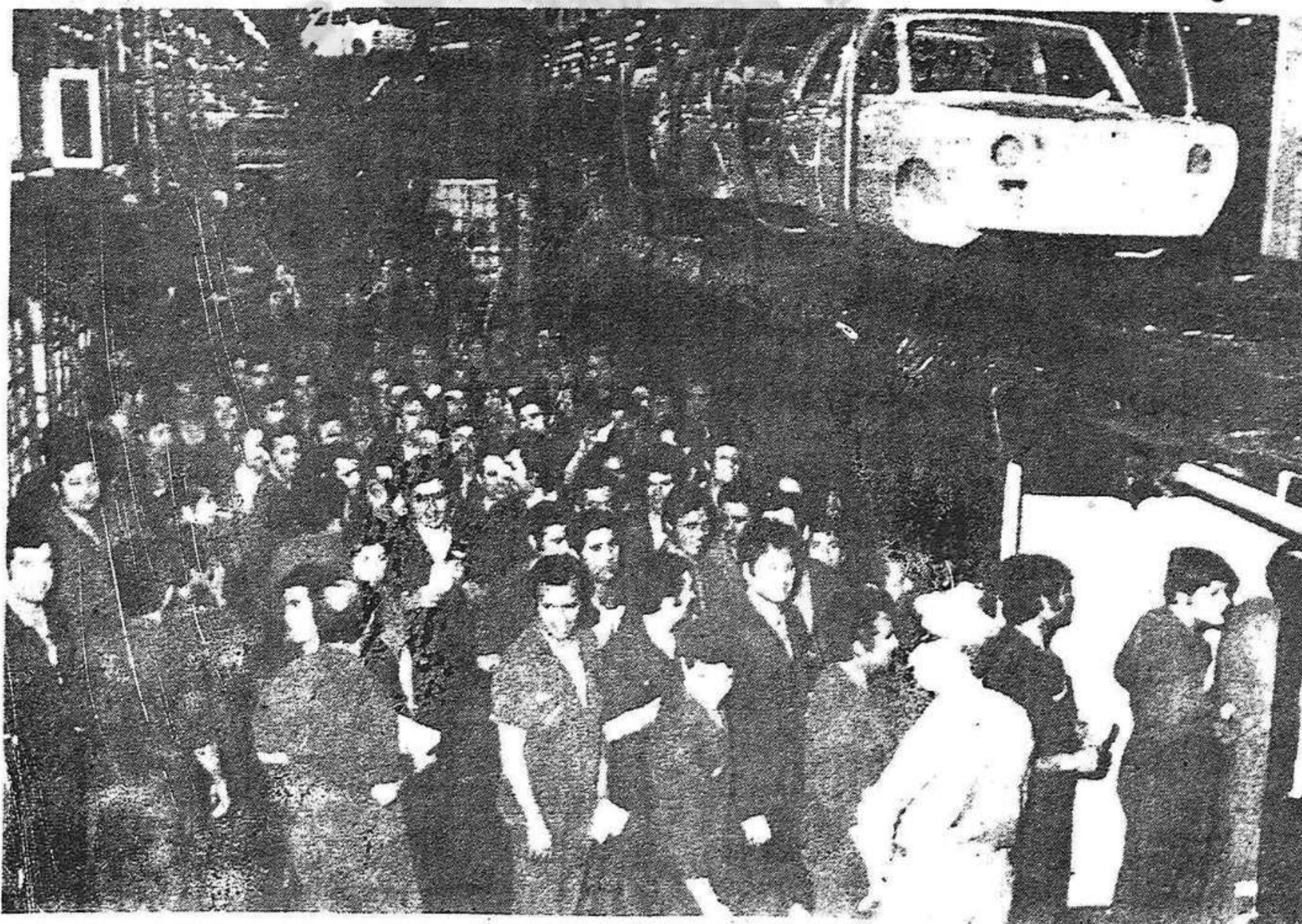
Les eleccions sindicals a la SEAT

La feblesa i més gran aïllament de la dictadura, la victòria de la classe obrera en les recents eleccions sindicals, han de permetre, els propers dies, fer un nou salt endavant en la conquesta de les reivindicacions, del sindicat de classe, de la llibertat. A això mateix, sense perdre temps. A tota la classe obrera, grans, mitjanes i petites, cal que fer assemblees on s'expliquin les raons i la necessitat de la vaga i prenguin acords a fi de garantir l'èxit. Els nous càrrecs sindicals de les candidatures democràtiques seran element de gran importància en la mobilització i coordinació, al costat dels antics dirigents obrers del ram.