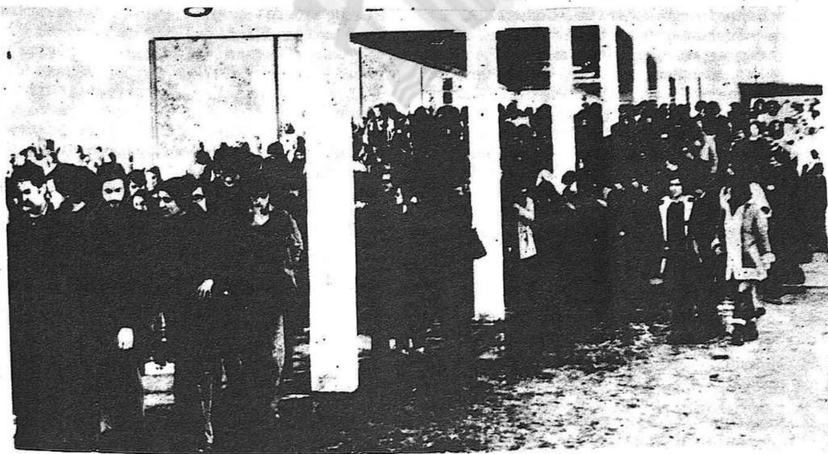
La lluita de les masses arracona el govern al búnker (Una recent manifestació d'estudiants)