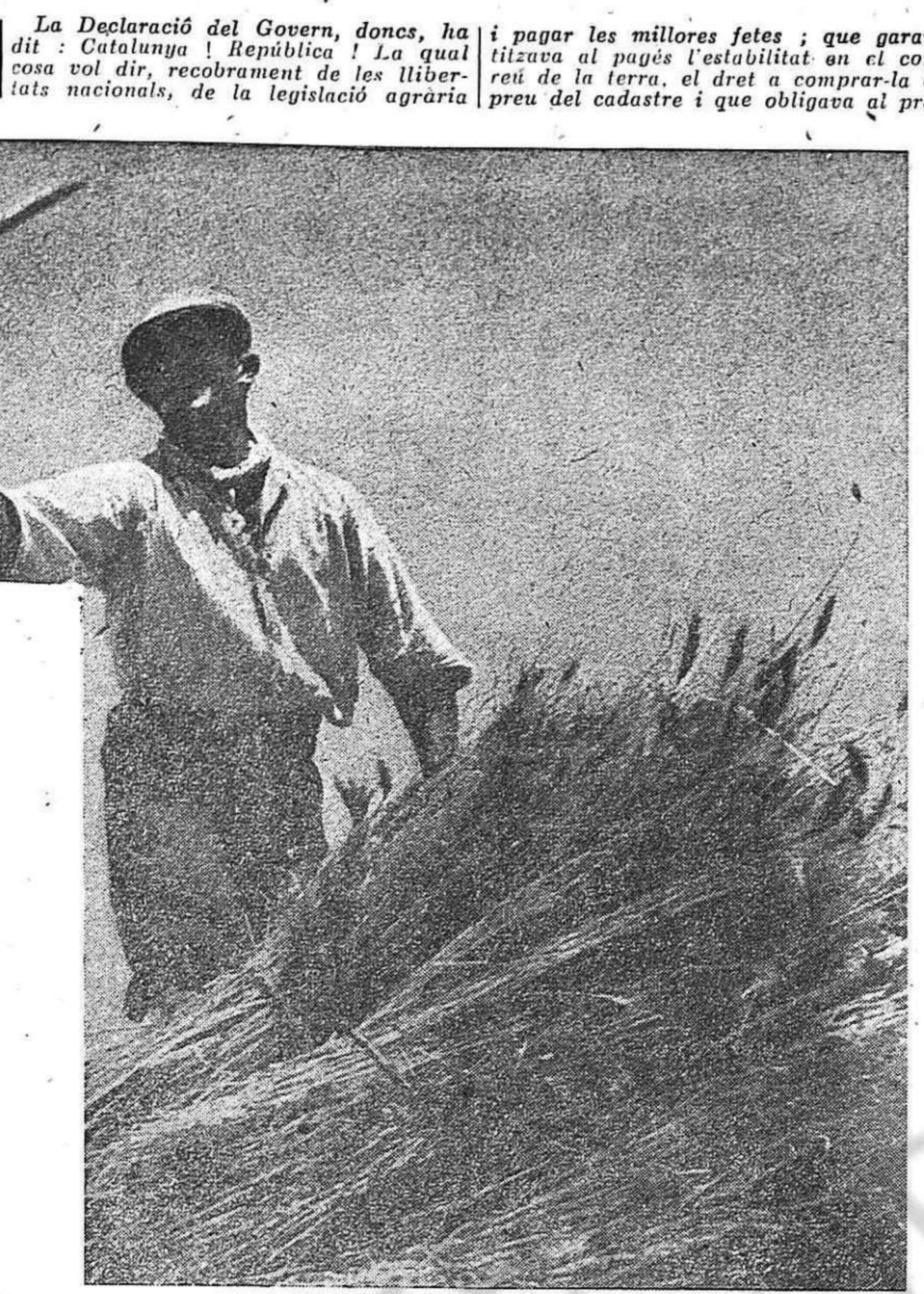
que preveia la confiscació de la terra als feixistes, la justa redistribució del treball pagat; que obligava a incenariar...