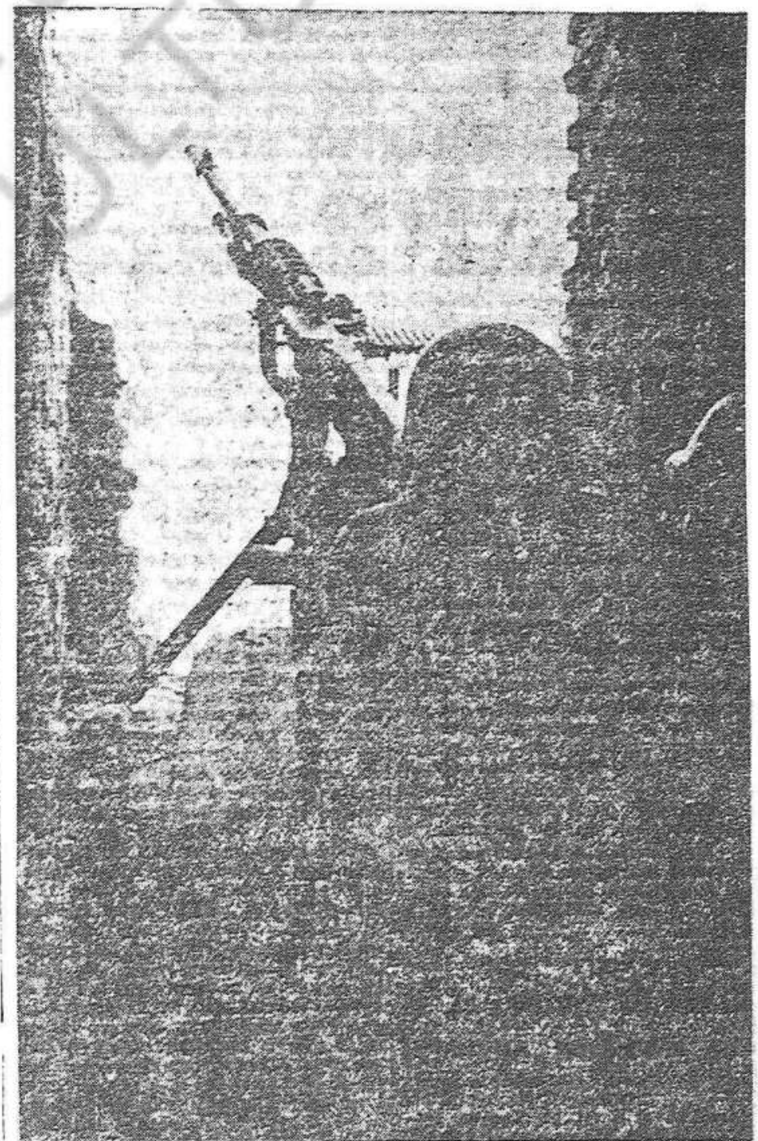
Preparats per contrarestar qualsevol atac feixista. La metralladora és dels milicians una bona arma antiària.

De totes maneres l'assemblea de demà diumenge al Teatre Triomf (a les 10 del matí) dirà el parer de la majoria de contramestres i l'acord de l'assemblea ha d'ésser respectat per tothom.