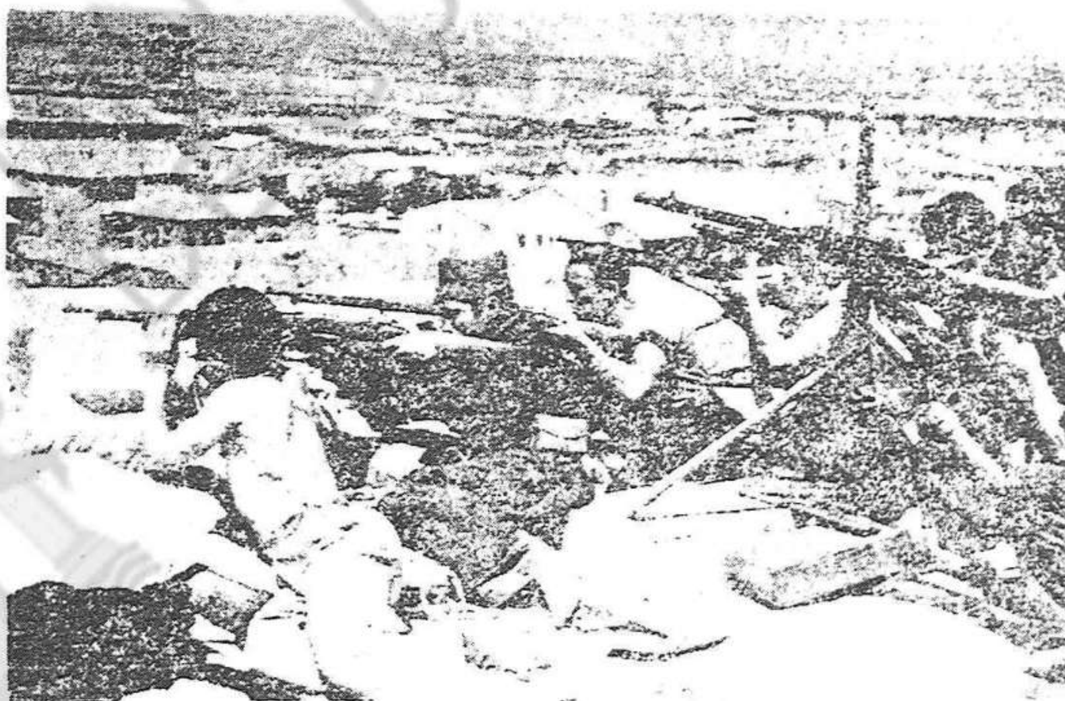
Sastago, Tardienta, Sietamo, un rera l'altra els pobles aragonesos són alliberats del jou feixista pels nostres milicians