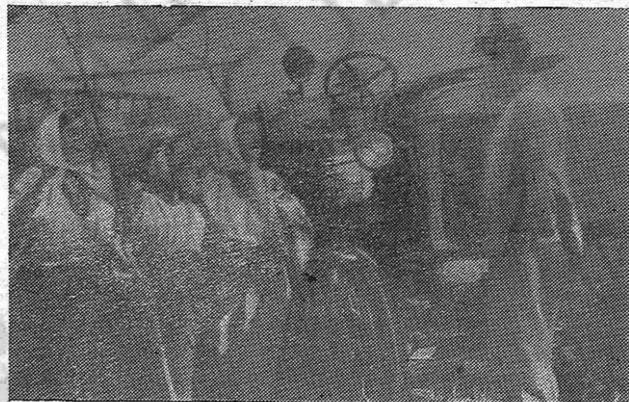
En los países verdaderamente democráticos, el pueblo se entrega con entusiasmo a la reconstrucción de la Patria, a su prosperidad y desarrollo pacífico, a la consolidación de su soberanía nacional. Contra los imperialistas que propugnan una nueva guerra, constituyen la fortaleza de la democracia, la más firme garantía de la paz entre los pueblos.

La lucha entre estos dos campos, entre el campo imperialista y el campo antiimperialista se desarrolla en las condiciones de la acentuación continua de la crisis general del capitalismo, del debilitamiento de las fuerzas del capitalismo y la consolidación de las fuer-