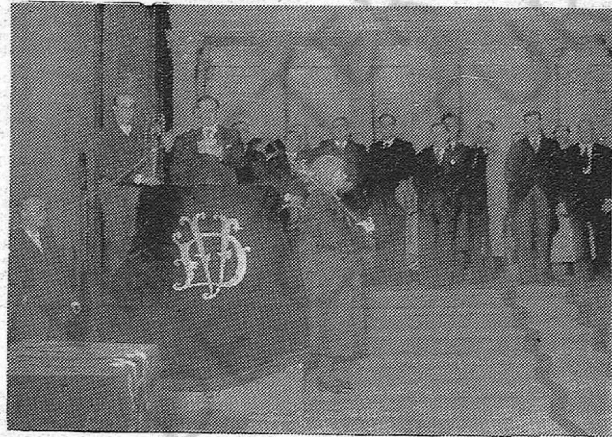
El 7 de Octubre de 1936, en plena guerra contra el fascismo, haciendo uso de la autonomía acordada con la República. Euzkadi constituía su Gobierno. El Presidente, D. José Antonio Aguirre, comunica a todo el País este fausto acontecimiento en el camino de la libertad y desarrollo democrático de Euzkadi.