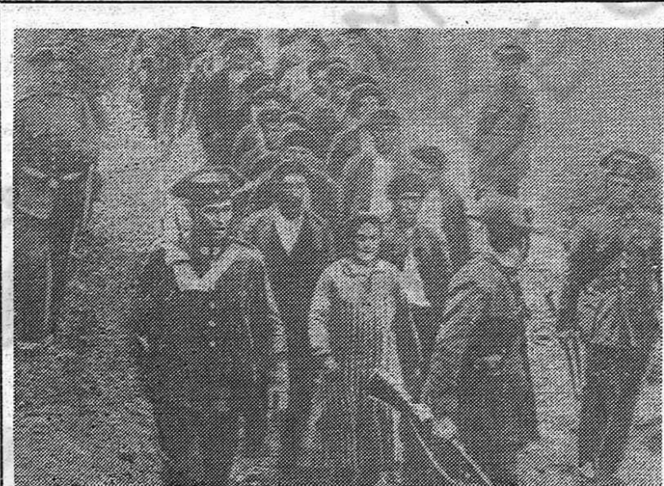
Fuerzas de la Guardia Civil mandadas por el general Lopez Ochoa se libran en octubre de 1934 a una verdadera carnicería contra el pueblo de Asturias. La fotografía reproduce un grupo de mineros que van a ser fusilados. Con renovado furor, el franquismo prosigue día tras día la barbarie de aquellas jornadas, trágicas pero gloriosas, en que los pueblos de España se levantaban ya contra las primeras manifestaciones del fascismo en nuestra Patria.

Radio Euzkadi en su emisión del día 21 de Sept.