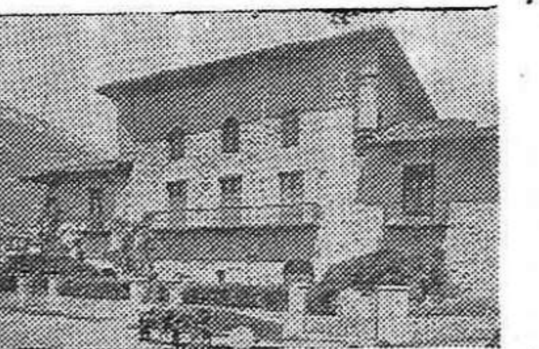
Casa solariega de los Enparan, en Azpeitia, donde muchas veces se reunieron los famosos Caballeritos de Azcoitia.

Euzkadi, como todos los pueblos de España, beneficiará, muy particularmente, de esta ayuda valiosísima que nos ha prestado la Unión Soviética. Y como de las gargantas de todos los hombres del mundo que aman la libertad, surgirá, surge hoy ya, de toda Euzkadi el grito de « Gracias Stalin, gracias pueblo soviético, por la ayuda que has prestado a nuestro pueblo educando a nuestra juventud ».