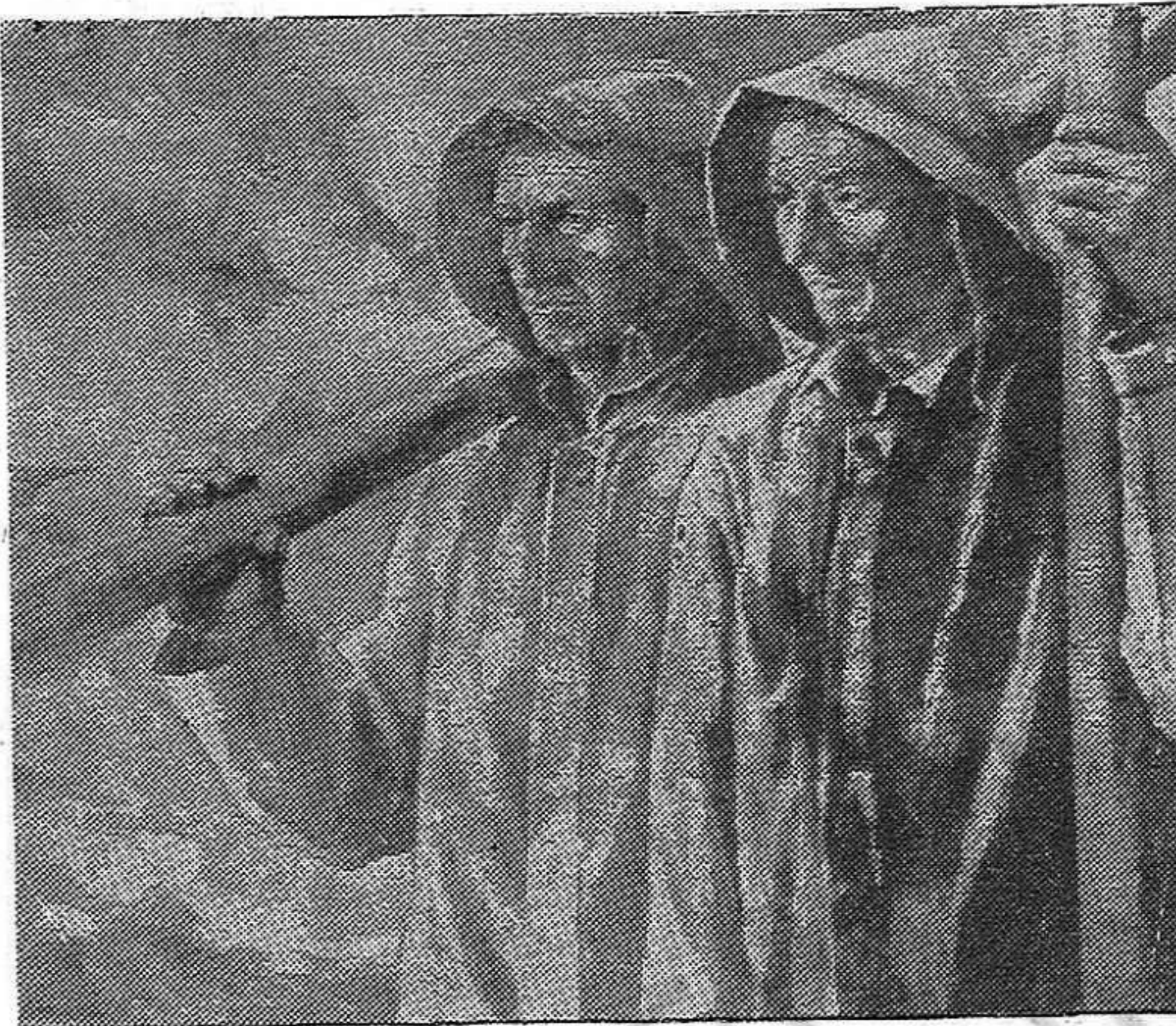
Después de haber sumido a los arrantzales en la miseria, Franco ofende a los pescadores vascos afirmando que el hambre de sus hogares se debe a su desconocimiento de la pesca. Con su unidad y a través de la lucha, los arrantzales venceran en las acciones reivindicativas para mejorar sus miseros salarios.

En una palabra, seria conveniente que la voz del Gobierno se dejase oír ratificandose en su propia politica, ratificando como buena la orientacion hasta ahora seguida por la Resistencia, indicando la necesidad de seguir todos por ahí seguros de que marchamos por el buen camino, seguros de que los obstaculos seran vencidos y la victoria alcanzada.