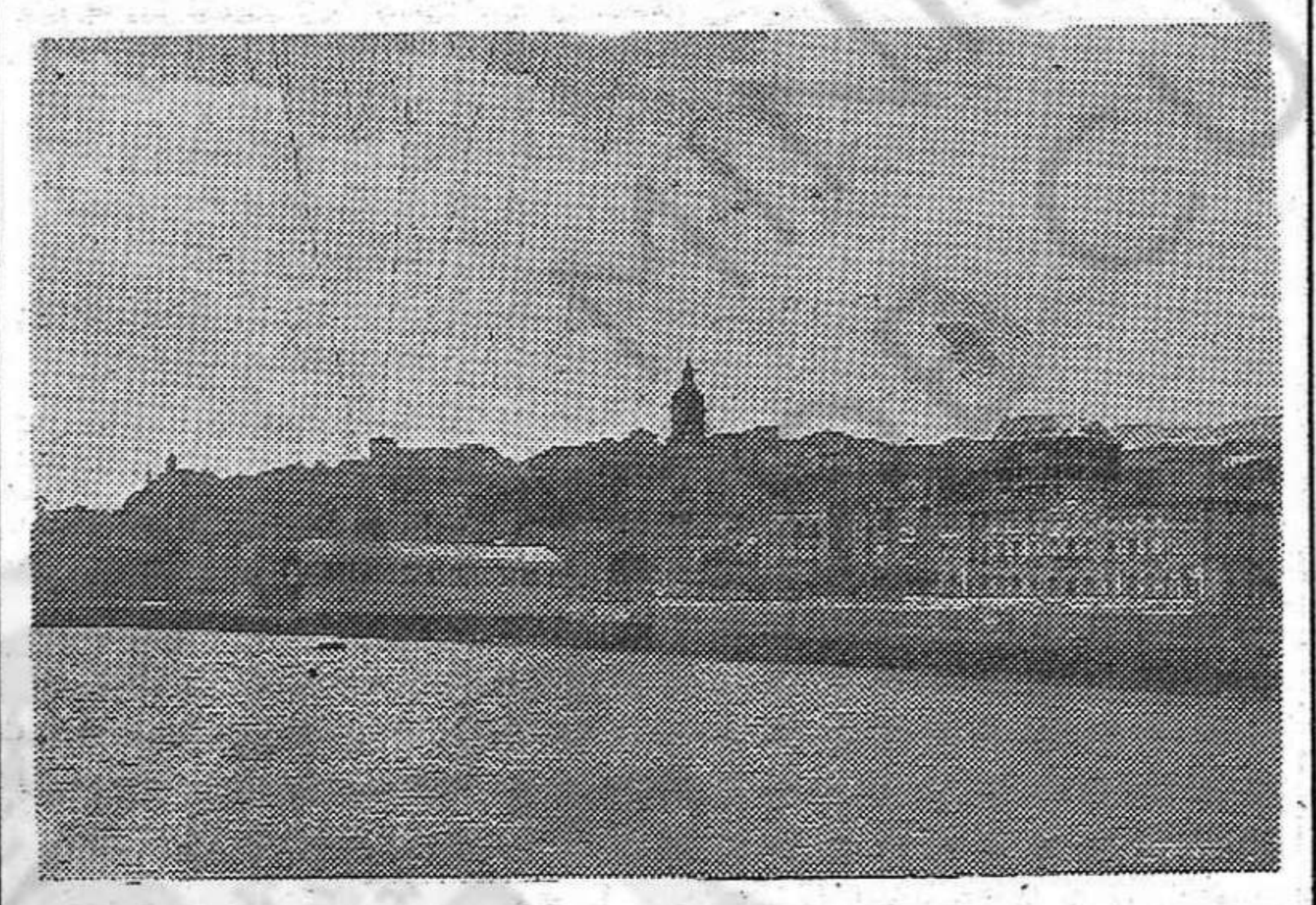
RINCONES DE EUZKADI. — Una vista de Portugalete y del Puente Colgante de Vizcaya.

como consecuencia de distintas apreciaciones de los problemas. Pero si ello no se puede deducir la conclusión de que no se llegará a un acuerdo. Contrariamente a los pronósticos tendencias de la reacción mundial, los representantes de las grandes potencias se han puesto de acuerdo sobre unos cuantos de los motivos fundamentales de discusión. Hasta el presente las decisiones aceptadas unánimemente por la Conferencia afectan en dar al Consejo de Control la directiva de acelerar los trabajos de liquidación de la industria de guerra alemana, el señalar un plazo fijo para la disolución de las formaciones de tipo militar alemanas o no alemanas y admitir que la suerte de la industria alemana no está ligada al problema de la integridad económica de Alemania. No son escasos los resultados de una semana de trabajo. La consolidación de la paz se abre camino. La reacción mundial no cesará en sus propósitos de negar la importancia de estos acuerdos, de obstaculizarlos y desvirtuarlos. El mundo democrático debe permanecer vigilante. La política internacional, llevada hoy al conocimiento