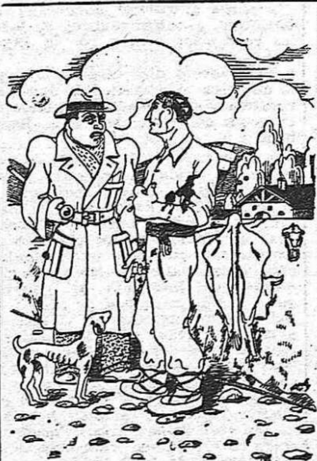
—Que fiaco está el ganado; ¿hay epidemia? —¿Epidemia?, peor que plaga de Egipto. Allí eran 12 vacas, pero aquí con régimen, requisas, vacas, nosotros y hasta perros estamos igual.

Y cuando la fábrica pare por iniciativa de los trabajadores, o en ella se reduzca el ritmo de la producción, pueden estar seguros que la Delegación de Abastos o quien quiera, con listas o sin ellas entregarán los viveres que hoy destinan a la especulación y al estraperlo.