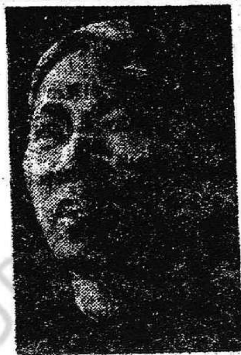
LE DUC THO.

Una declaració de LE DUC THO a "L'Humanité"