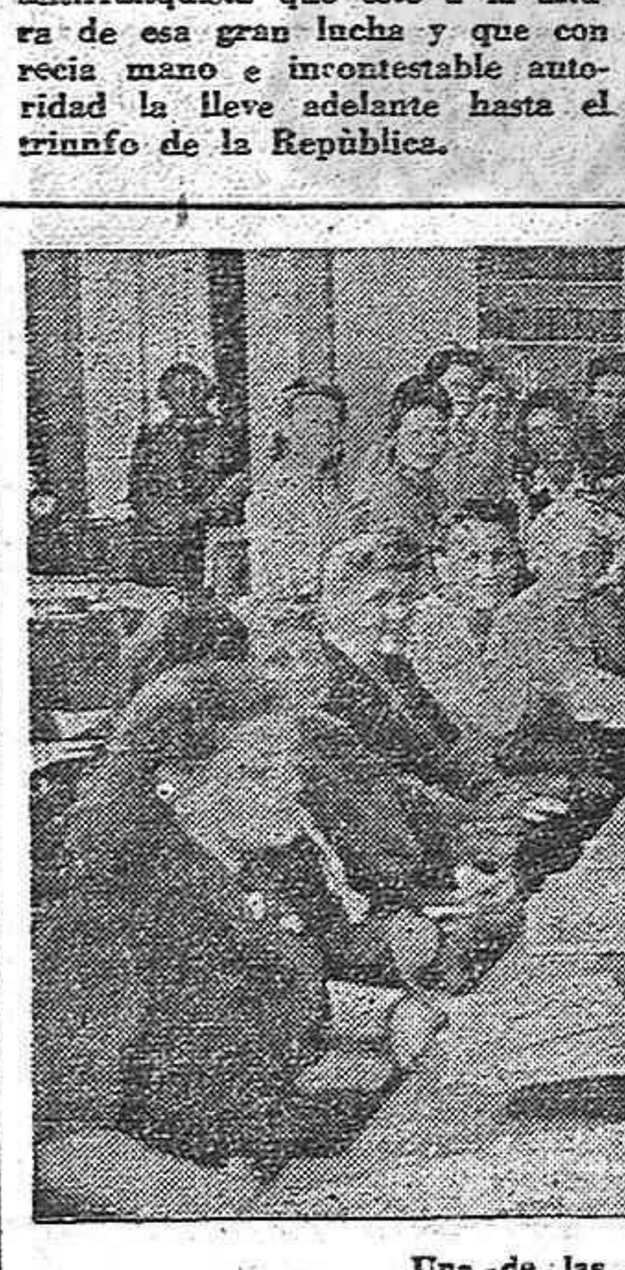
Una de las reuniones del Comité Ejecutivo de la F.D.I.M. en Estocolmo.

Ayudar al pueblo español a liberarse de la tiranía fascista es, al mismo