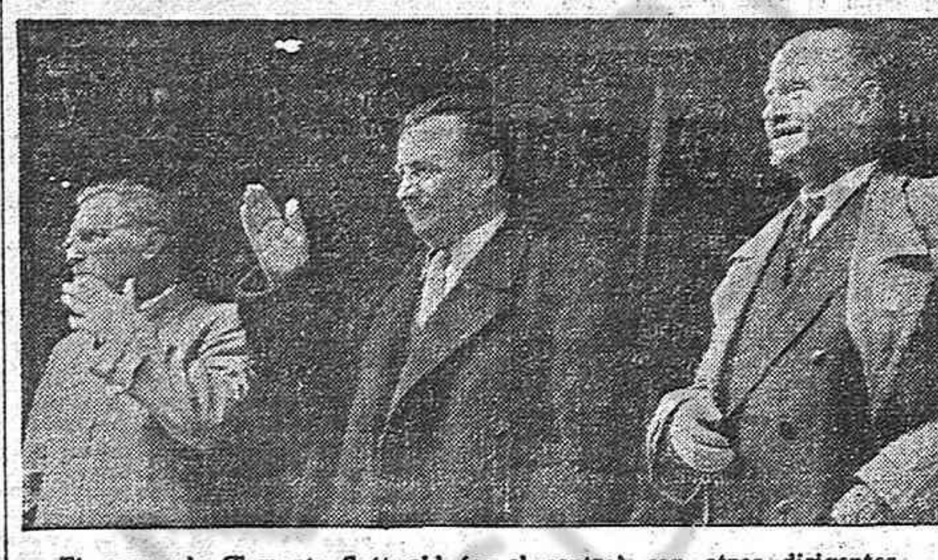
El camarada Clemente Gottwald (en el centro) con otros dirigentes del Partido Comunista checoslovaco.