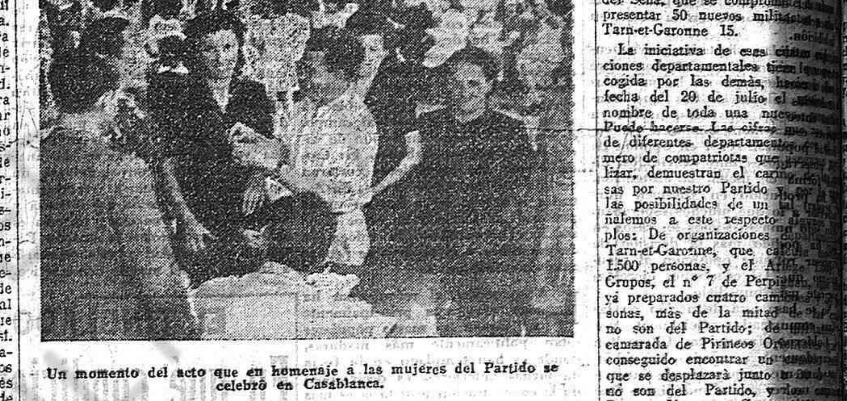
Un momento del acto que en homenaje a las mujeres del Partido se celebró en Casablanca.