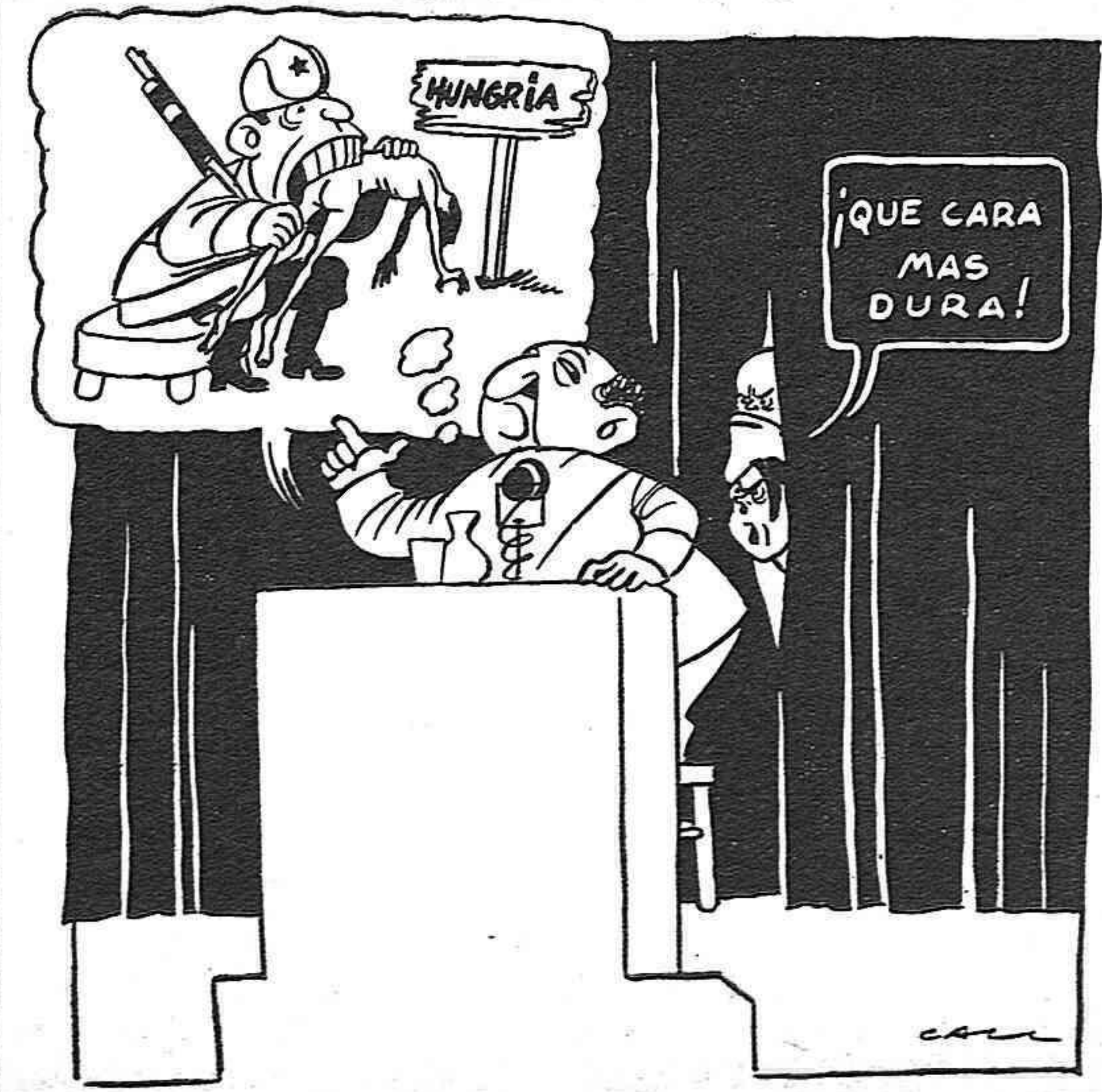
«El generalísimo Franco hará formular ante la O.N.U. una protesta contra la intervención sangrienta de tropas extranjeras en los asuntos interiores de Polonia y Hungría.» (De la Prensa.)