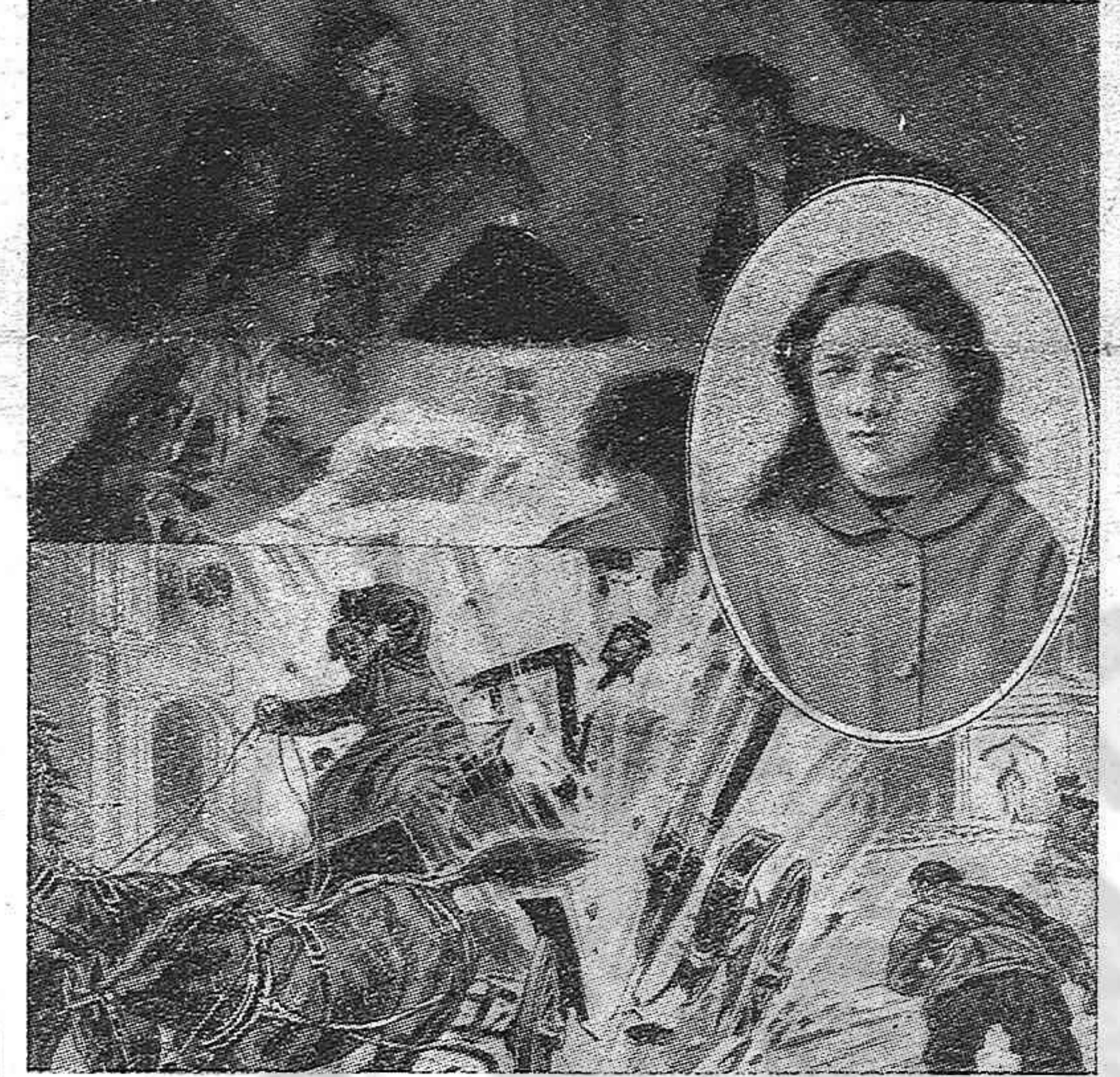
Tiempos heroicos del nihilismo ruso: atentado contra el Gran Duque Sergio, tío del Zar, gobernador de Moscú. En el óvalo, Vera Zassulitch, que atentó en 1878 al sanguinario jefe de policía Treppoff.

tariado» no solamente éste debía silenciar sus opiniones sino que también debían hacerlo los más destacados militantes de su partido «representativo». Conclusión: durante 30 años Stalin ha sido dueño de 200 millones de rusos, con un derecho de propiedad tan absoluto como podía serlo el de un señor feudal sobre sus siervos.