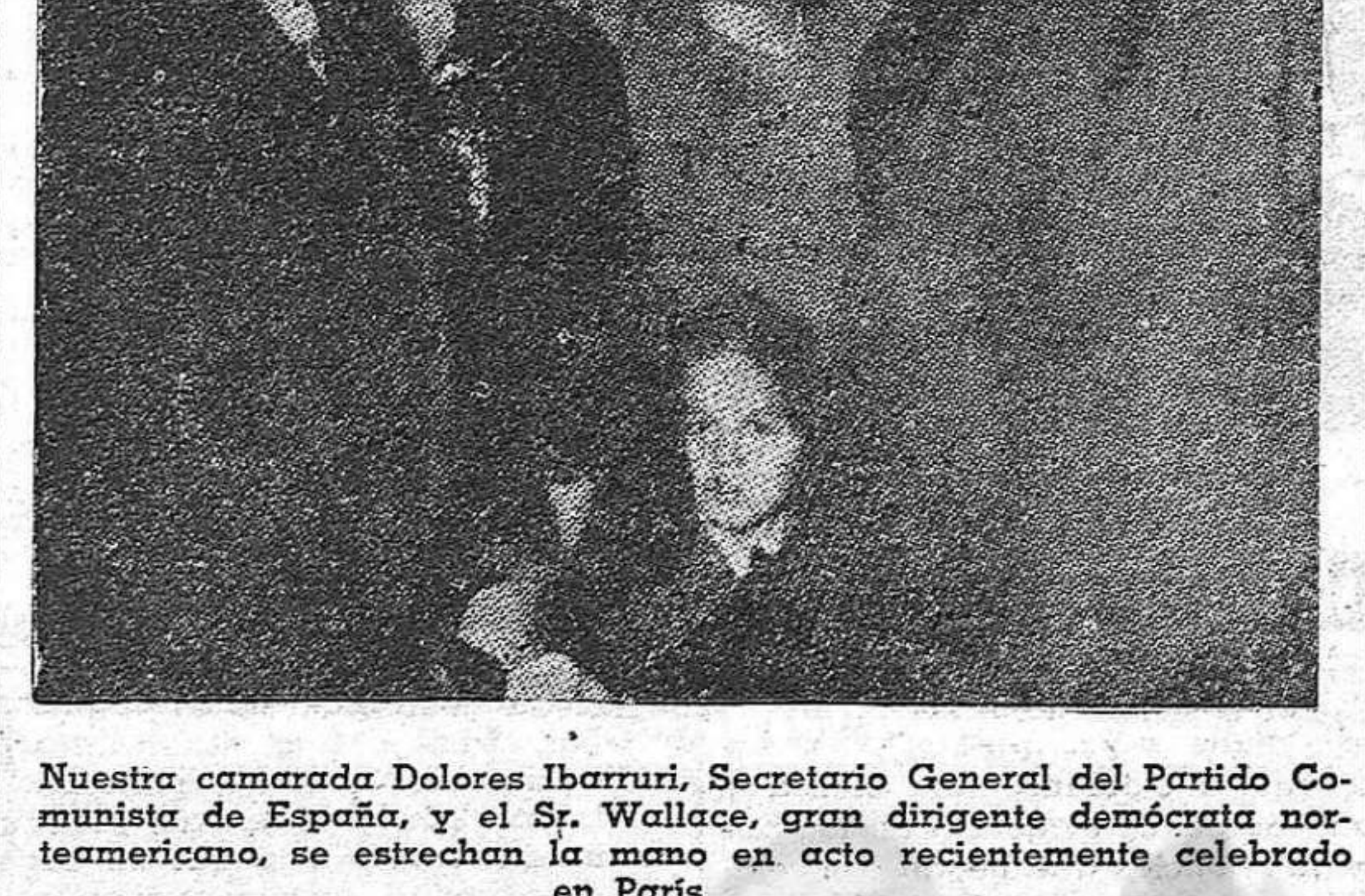
Nuestra camarada Dolores Ibaruri, Secretaria General del Partido Comunista de España, y el Sr. Wallace, gran dirigente democrata norteamericano, se estrechan la mano en acto recientemente celebrado en París

La inquietud e indignación que semejante situación produce en el pueblo son tanto más grandes cuanto que se anuncia como probable medida de represión la deportación a los campos de concentración de Ifni, en el Sahara español, de los más destacados huelguistas.