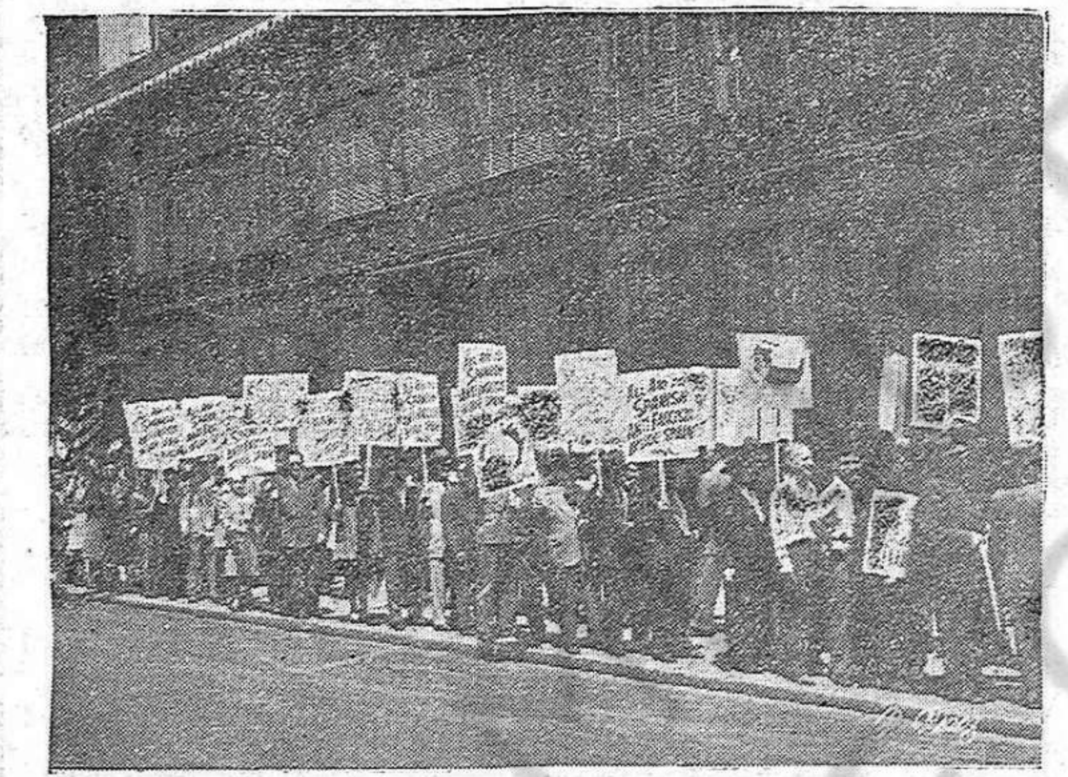
El 17 de mayo, durante varias horas, una gran multitud de republicanos españoles y demócratas norteamericanos establecieron un piquete frente al Consulado falangista de Nueva York, en protesta contra las represalias franquistas contra los bravos trabajadores de Euzkadi.

Stassen dice que en el pasado surgieron, entre la U.R.S.S. y los Estados Unidos de América malos entendimientos porque la parte soviética no manifestaba deseo de intercambiar ideas, lo que se expresó en la implementación de la censura para las informaciones de los correspondientes extranjeros de los periódicos. Por ejemplo, denegar el periódico New York Herald Tribune permiso para tener a su correspondiente en Moscú, fue una de las causas de que no existiera mutua colabo-