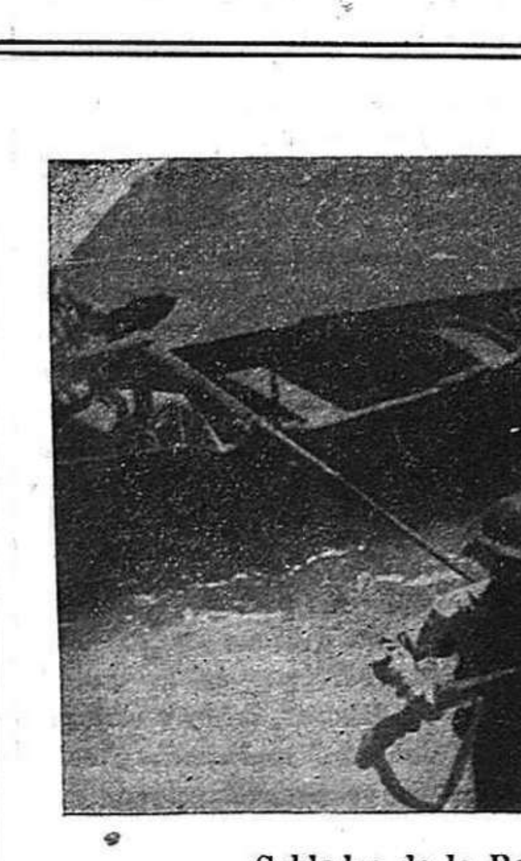
Soldados de la República en el Ebro.

mento del fatalismo geográfico, ha sido, casi siempre, sólo pretexto de gobernantes venales que han querido apoyarse en el explotador extraño, para oprimir y robar el país. Cuba y los países del Caribe y de la América Latina, pueden salvarse de las asechanzas de las hordas germánicas y de los ataques del imperialismo yanqui, mediante su unidad, unidad interior y unidad continental. Cuba, en esta hora crucial del mundo, puede y debe salvarse. Frente a la Reunión de Cancilleres, de entrega y sumisión al imperialismo, nosotros proponemos una verdadera acción de los pueblos contra el nazi-fascismo, exterior e interior, por asegurar su progreso, su bienestar y su independencia. Una alianza de los países Latino-Americanos, con el proletariado revolucionario de Norteamérica y del Canadá, si será una verdadera alianza contra el fascismo de Eu-