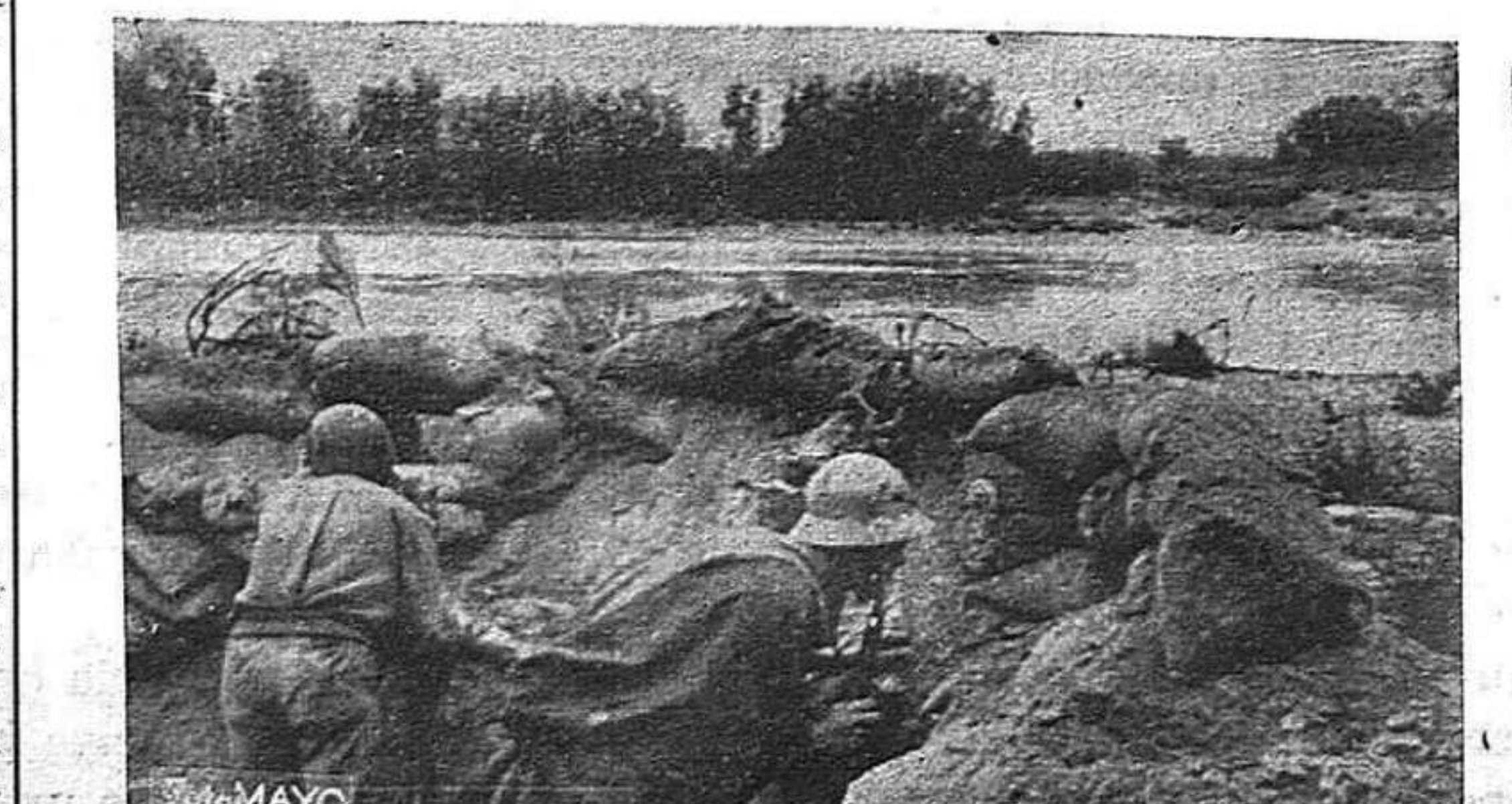
En las riberas del Ebro, en las noches que precedieron al paso del río por los soldados del Ejército Popular

La agresividad de la España franquista en política exterior se explica en primer lugar por la derrota de Francia, y por el debilitamiento de las posiciones de Inglaterra en el Mediterráneo. Estando efectuándose una correlación de fuerzas en el campo internacional, no está excluido que España pueda conseguir arrancar ciertas partes del botín. La política exterior de la España franquista, no es un factor independiente sino un reflejo de los intereses, planes y luchas políticas exteriores de las grandes potencias imperialistas".