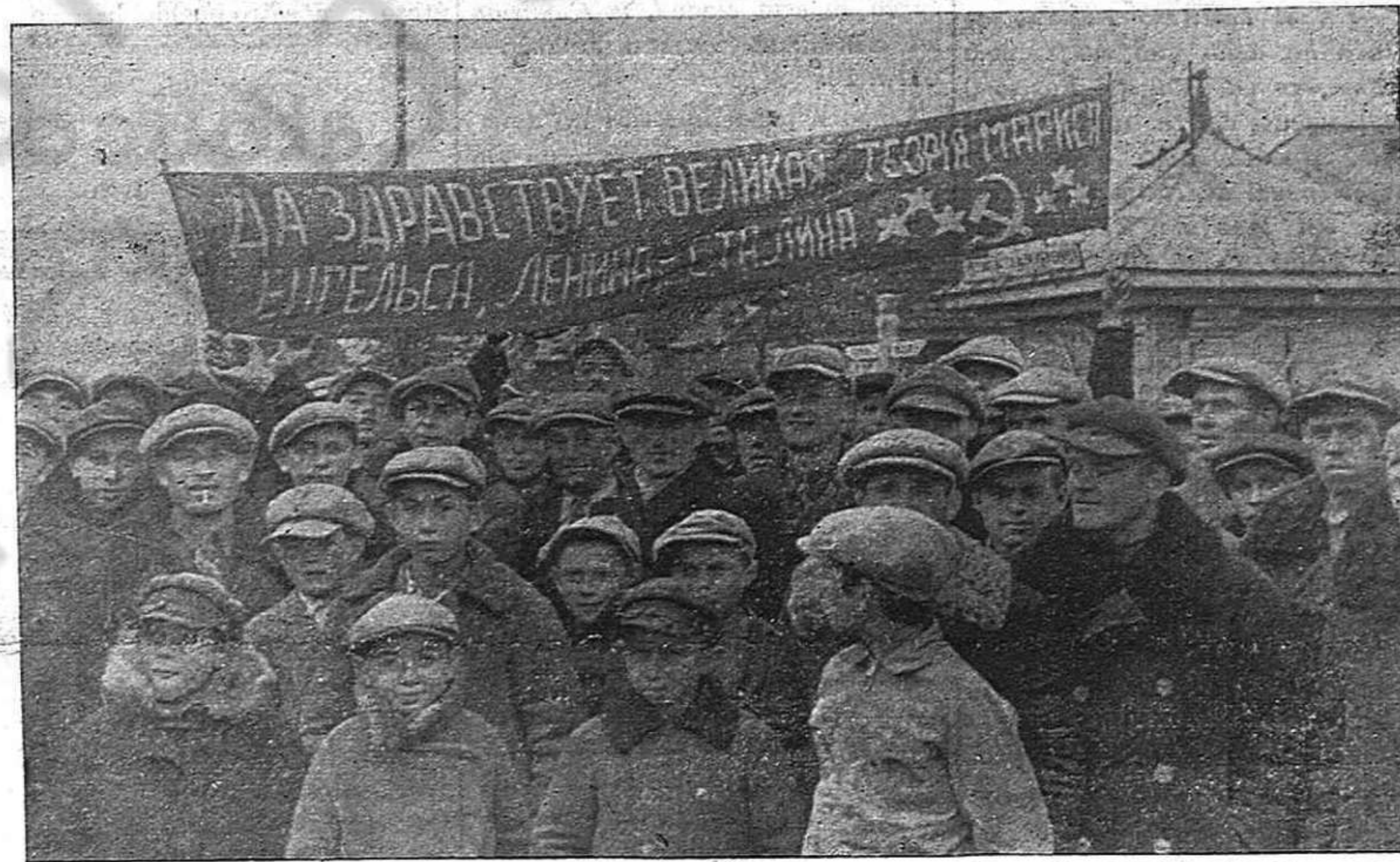
Cuando el Ejército Rojo entró en Polonia, los campesinos se organizaron para recibirlo jubilosamente porque era un ejército liberador y no un ejército imperialista de conquista y de opresión. El mismo júbilo hay ahora en los países bálticos, liberados de la explotación capitalista.

Frente Popular. En la real situación de hoy, solamente nosotros, los comunistas, representamos y defendemos los intereses del pueblo español en todas partes. Es por esta razón que la reacción echa todo su veneno sobre los comunistas. Puede la reacción cebarse sobre nosotros, pueden arrojar a las cárceles y a los campos de concentración a los mejores de nuestros camaradas; pero jamás conseguirán encarcelar o asesinar al comunismo. El comunismo es hoy una necesidad vital e indispensable para las masas, porque ven y verán por su propia experiencia la bancarrota completa del capitalismo.