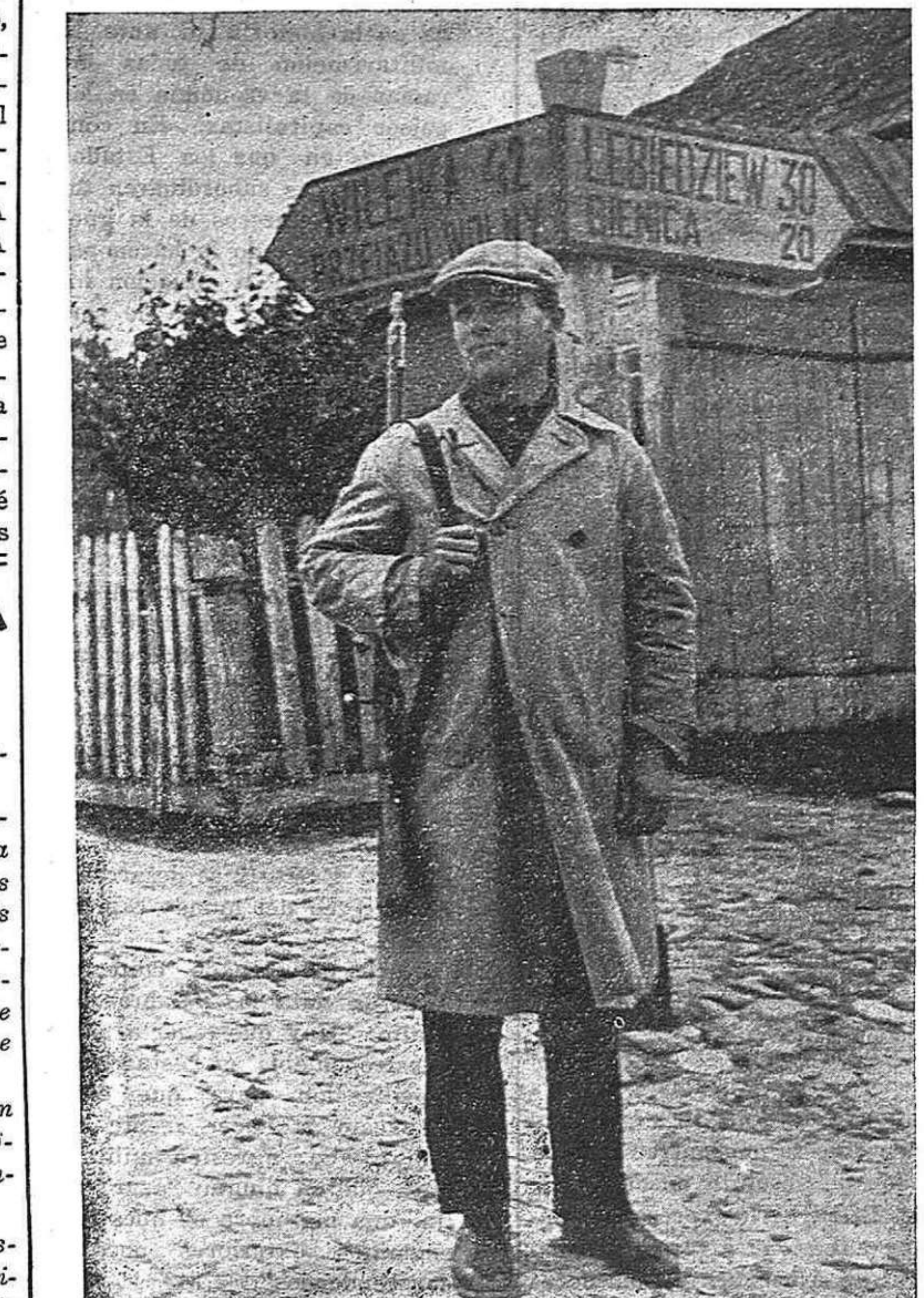
Apenas el Ejército Rojo entró en Polonia, los trabajadores organizaron milicias obreras para secundarlo en su labor liberadora.

Hace algunos años, cuando se formó el Frente Popular, París y toda Francia vieron el ímpetu indescriptible del pueblo unido en la lucha por el pan, por la libertad y la paz. Pero gracias a los esfuerzos de los Blum y Daladier, el Frente Popular fué traicionado y roto, la reacción beligerante tuvo manos libres y vía abierta a las aventuras militares. Las consecuencias están ahí: El declive de la Tercera República, el gran capital pasa a formar una abierta dictadura, y el pueblo queda privado de los derechos y libertades democráticas mas elementales.