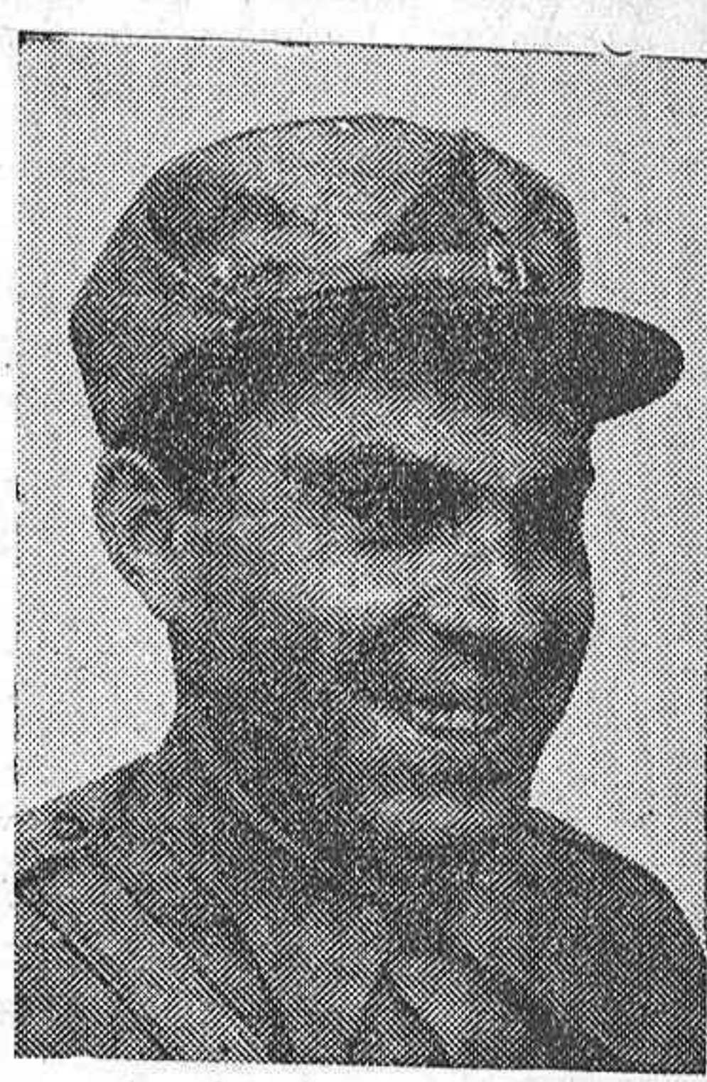
no te oíste que me gusta verme ahora con la seriedad del hombre grave que conoce su responsabilidad, y no con la frivolidad y encogimiento del hombre cuando amenaza la tormenta.

«He venido de las tierras de Aragón a ganar la lucha que hoy es problema de vida o muerte, no sólo para el proletariado español, sino para el mundo entero. Todo se ha concentrado en Madrid, y no te oíste que me gusta verme cara a cara con el enemigo, siquiera porque se ennoblec más la lucha. Antes de marchar de Cataluña pedí conciencia a los que están interesados por lo mismo. No me refiero a los pobres de alma y de energía. Me refiero a los que estamos empeñados en dar el empujón posterior. Los fusiles no hacen nada si no hay una voluntad y un cálculo en el disparo. En Madrid no hay duda de que no eran los fascistas, pero hay que echarlos pronto, porque a España hay que volverla a conquistar. Estoy contento en Madrid, pero me gusta verlo ahora con la seriedad del hombre grave que conoce su responsabilidad, y no con la frivolidad y encogimiento del hombre cuando amenaza la tormenta.»