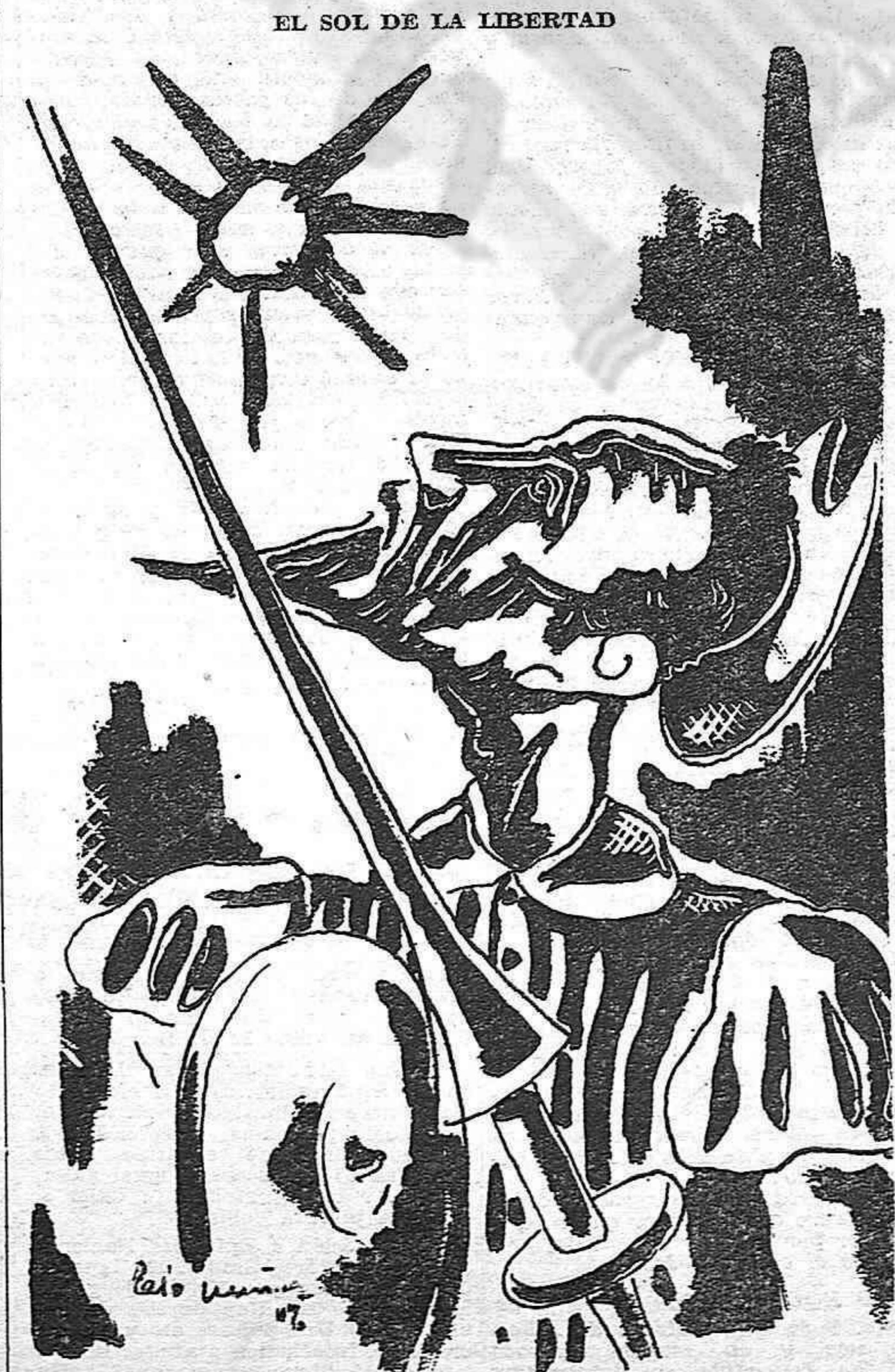
EL SOL DE LA LIBERTAD