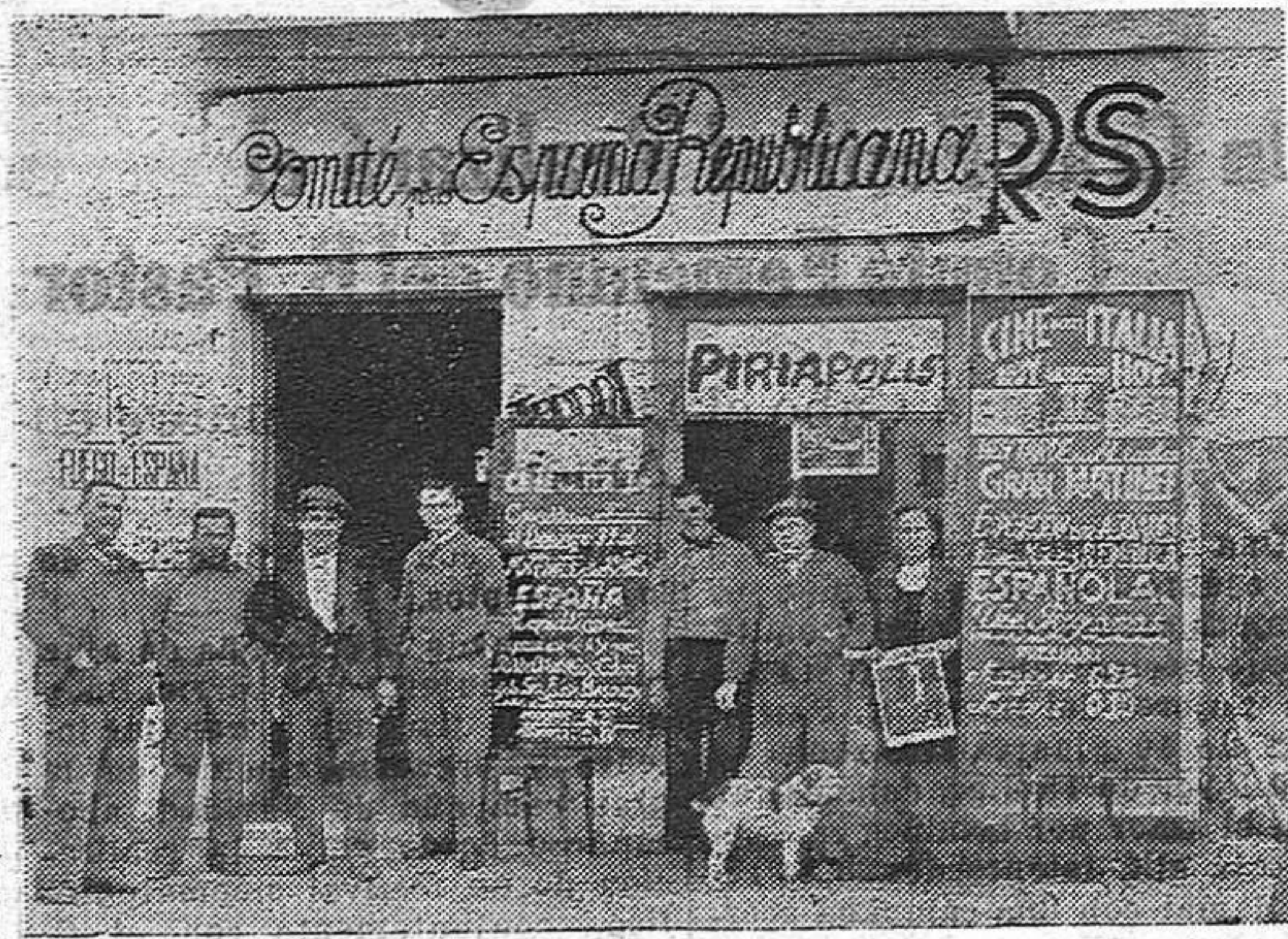
Local del Cine en el cual el Comité de Piriápolis inició brillantemente sus actividades, con un hermoso acto