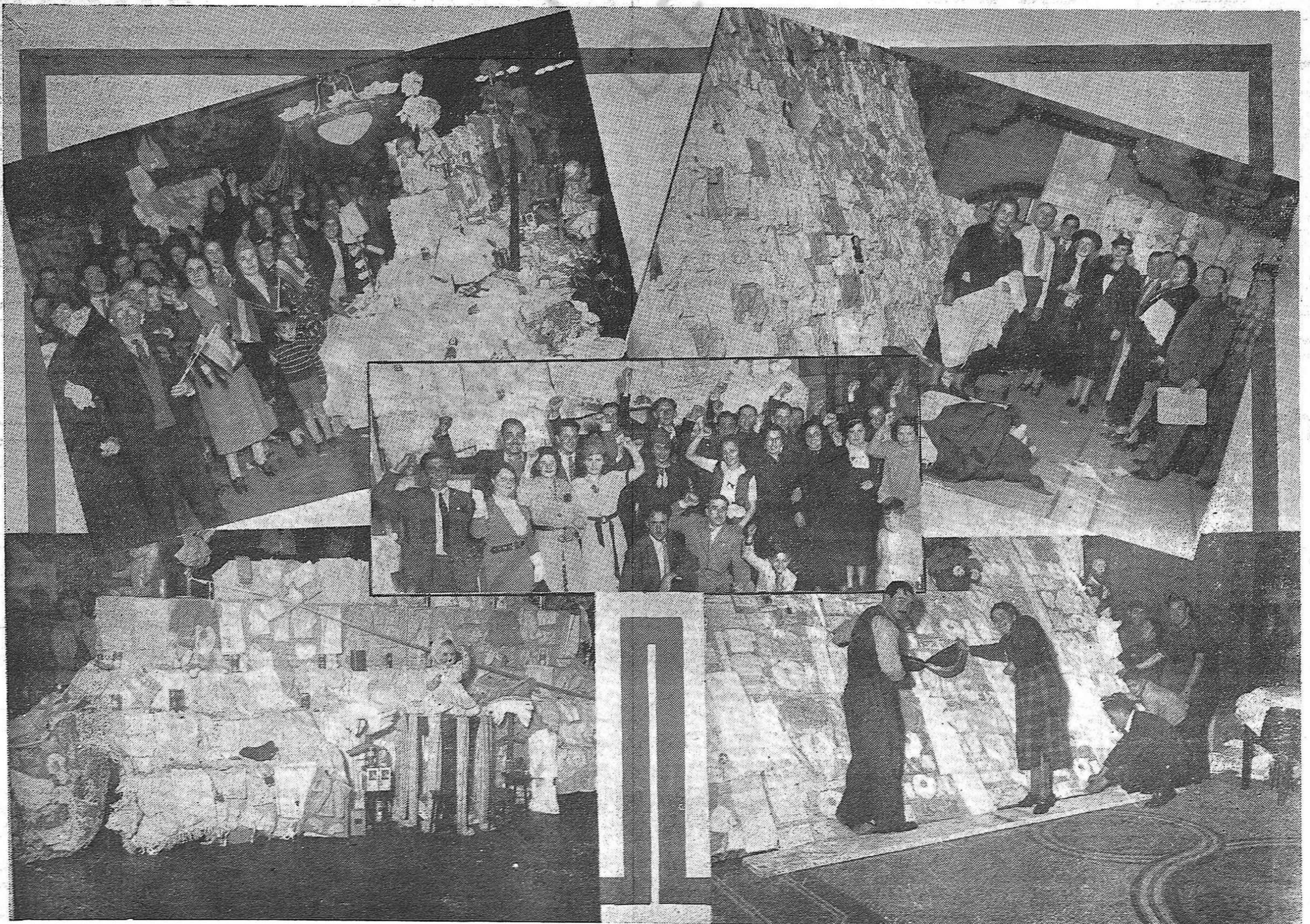
He aquí vistas parciales de algunos de los numerosos Stands de la Exposición de Ajuares que organizó la Comisión de Damas pro Ayuda al Pueblo Español, y que pudo visitarse el domingo y lunes pasado en el Palacio Salvo. — Ellas permiten apreciar el volumen que alcanzó esta campaña, a través de la cual la mujer uruguaya acudió en ayuda de la infancia española