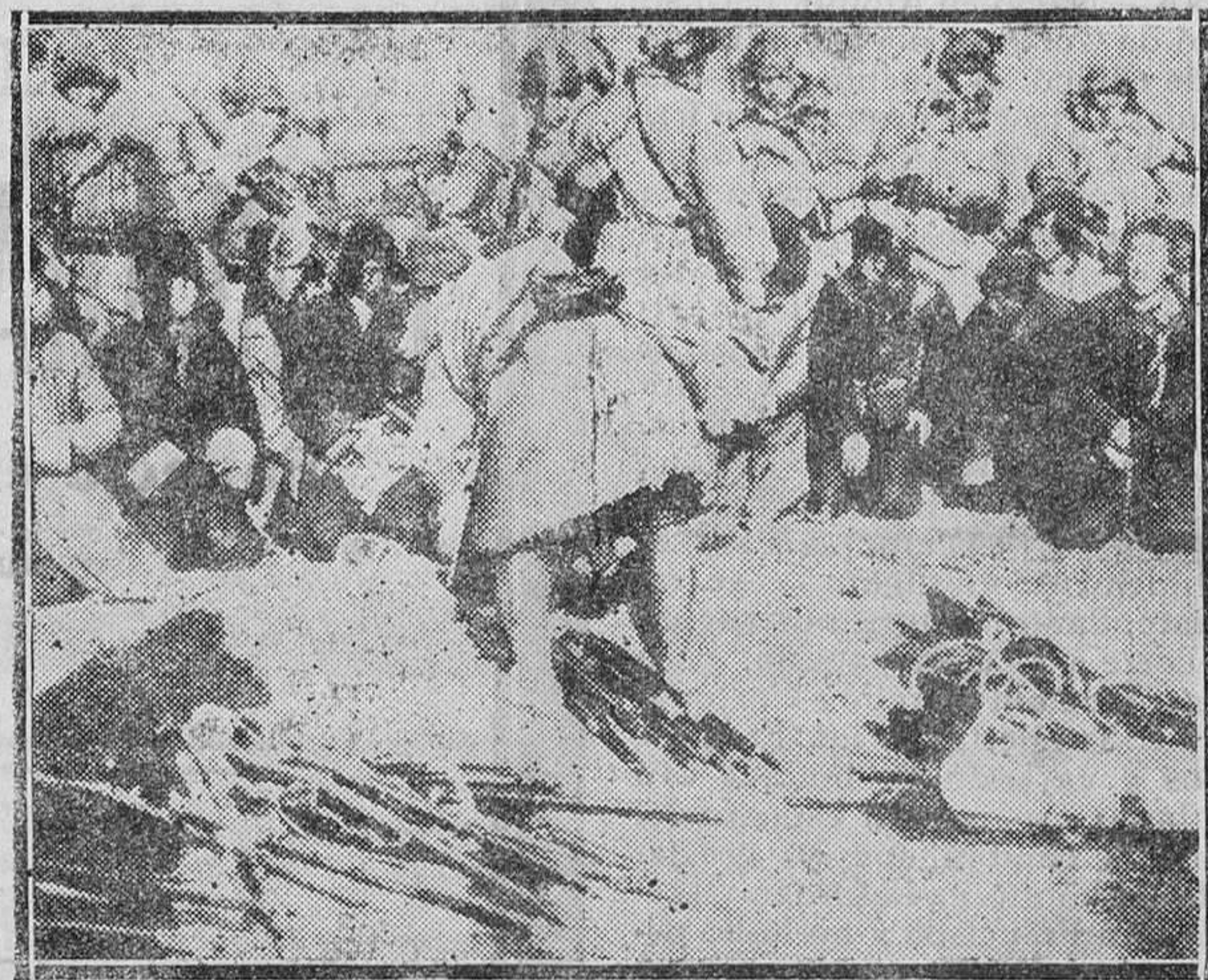
LOS SUCESOS DE ORIENTE.—Soldados japoneses en el momento de detener a una patrulla de bandidos chinos

Salvo en la parte religiosa cualquier político de derechos hubiera podido combatir al actual Gobierno con sus propias palabras a pesar del abismo de ideas que de él la separa.