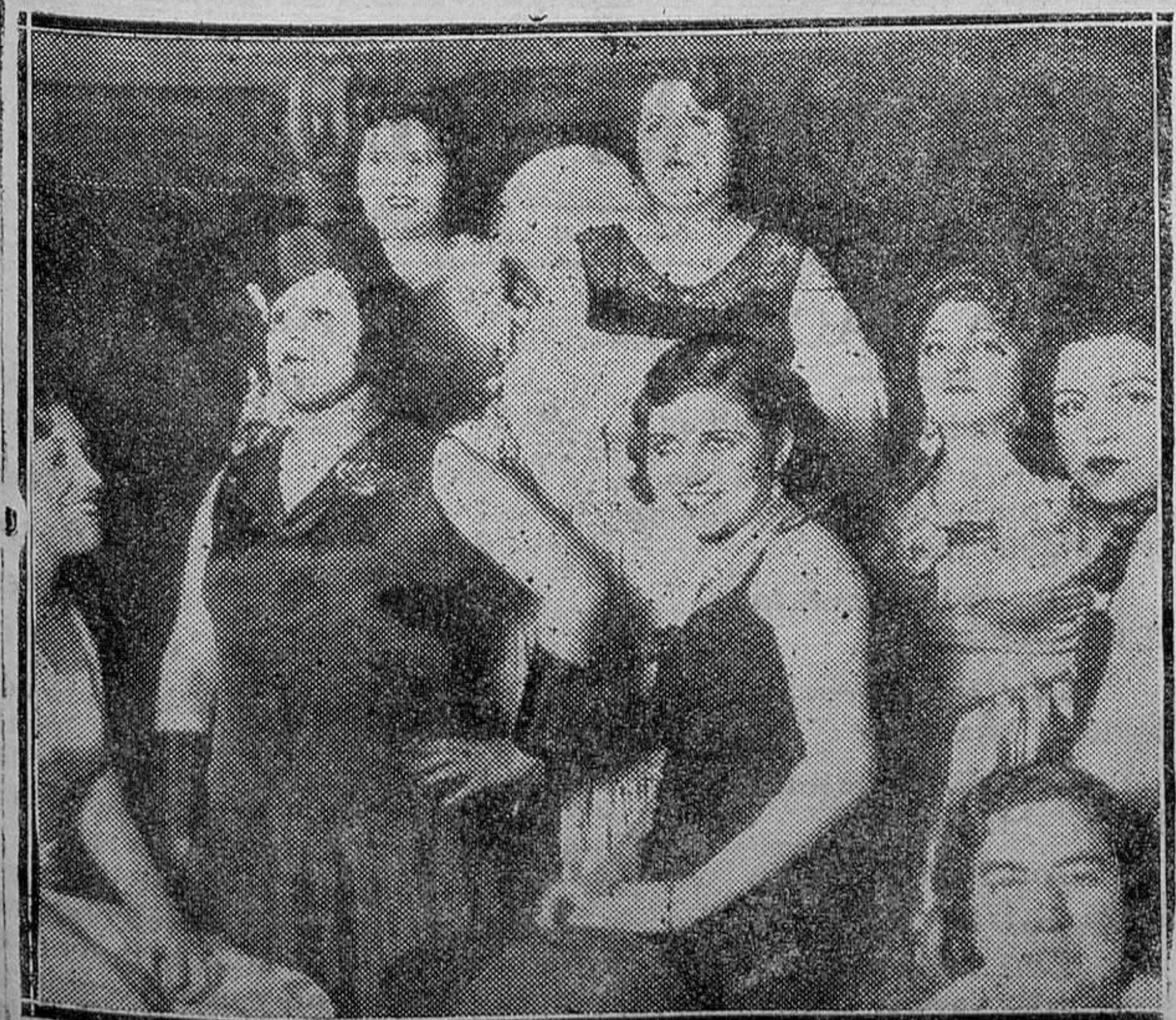
MADRID.—Aspecto de un palco del Teatro de la Zarzuela durante el baile organizado por la Asociación de la Prensa