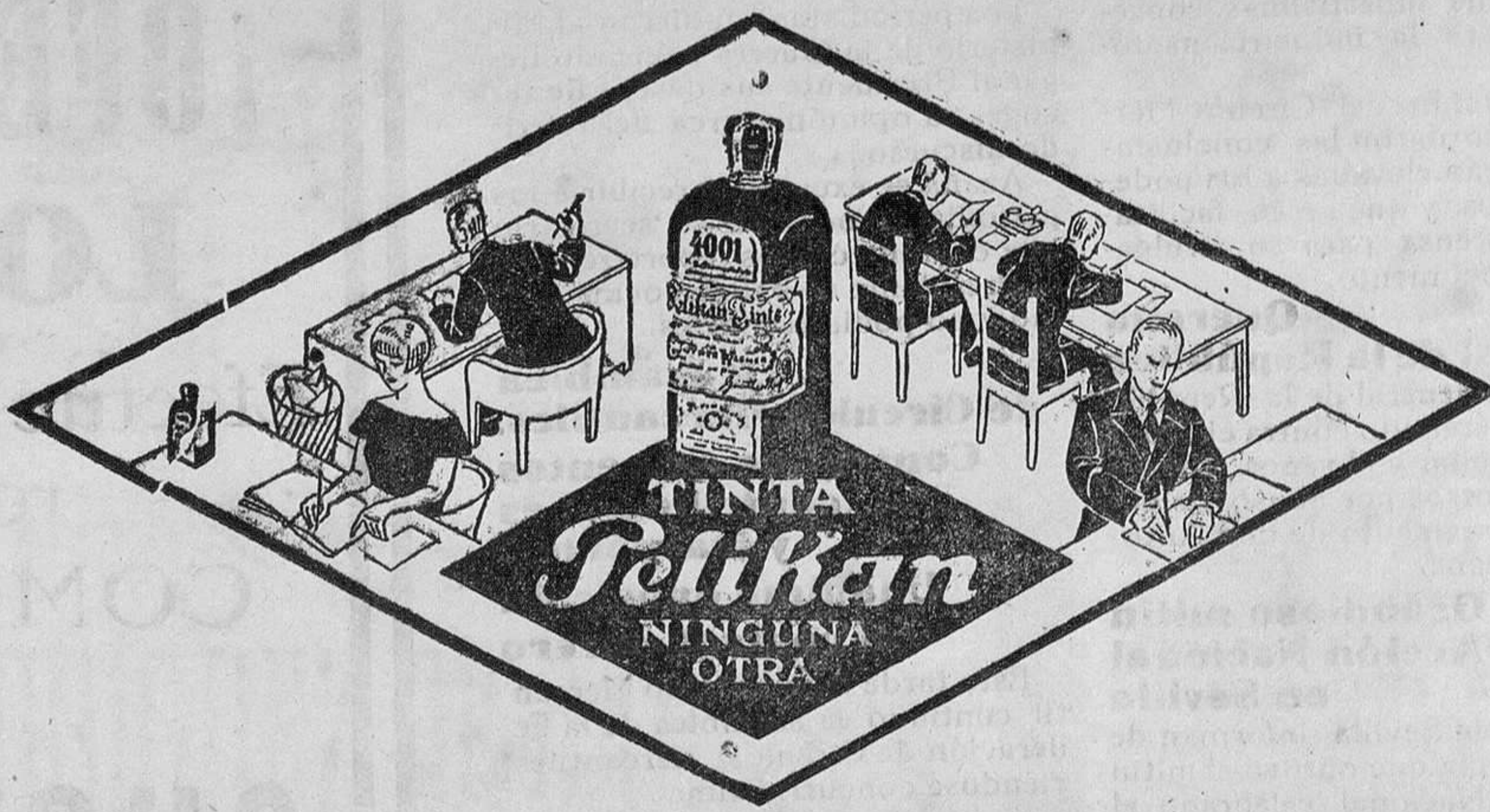
De venta en la Librería de Manuel Sintes Rotger, Plaza de Pablo Iglesias 17, Mahón

LIBRERÍA de MANUEL SINTES ROTGER Plaza de Pablo Iglesias, 17, Mahón Últimas obras recibidas