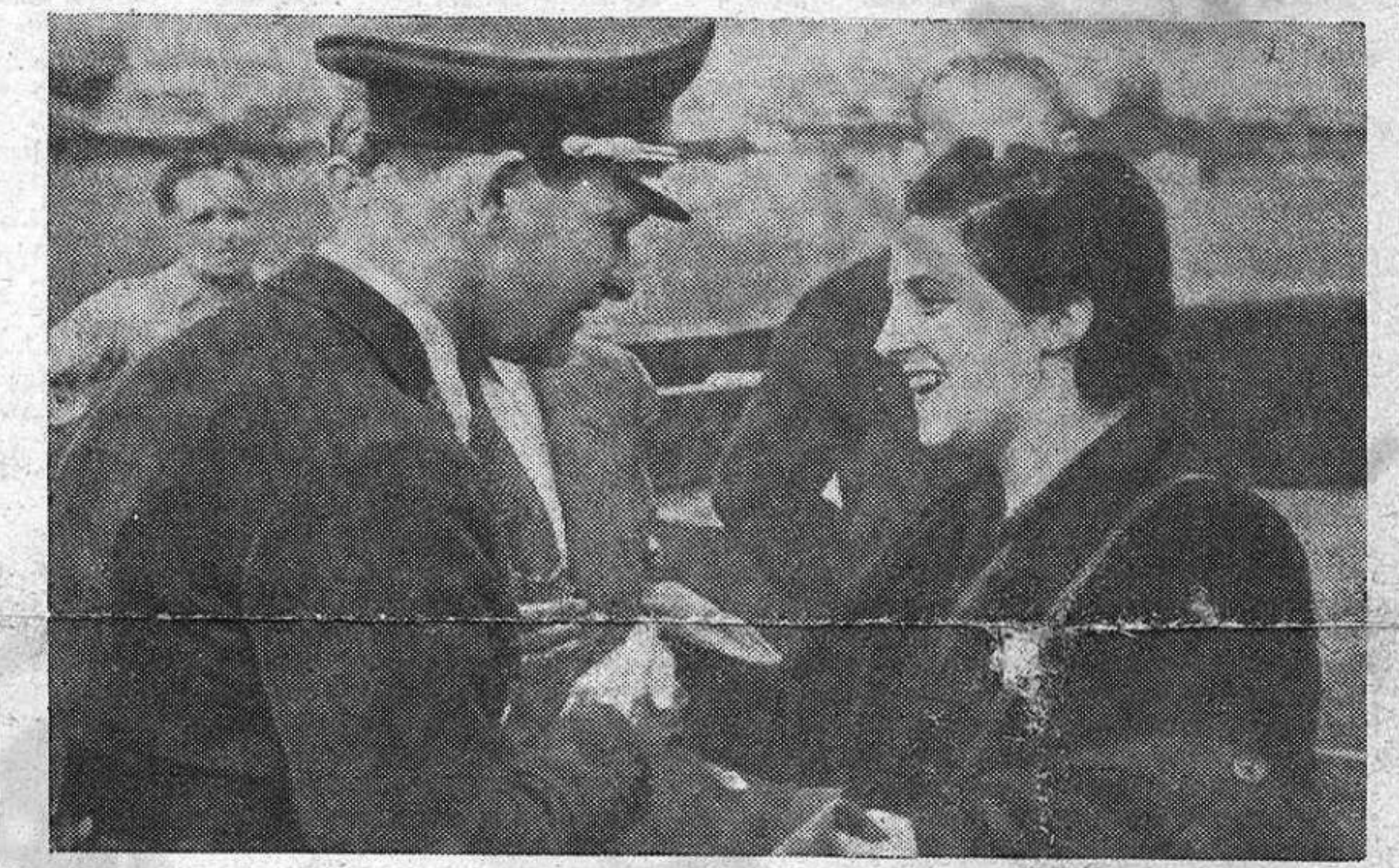
Apoteósico recibimiento en Berlín, durante el fuerte de la ofensiva nazi sobre el frente oriental, a Pilar Primo de Rivera, alias la «Hermanísima».