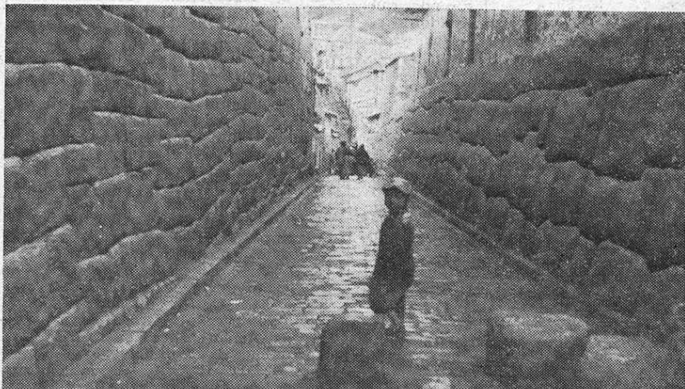
Una calle del Cuzco, que fue capital del imperio inca, captada por nuestro dinámico corresponsal.

el río Santa que desemboca en el puerto del mismo nombre donde la Corporación Peruana del Santa centra sus actividades. En este departamento se levanta el pico más alto del Perú, el Huascarán, que con sus 6.807 metros se coloca el primero de todos los encontrados en el viaje.