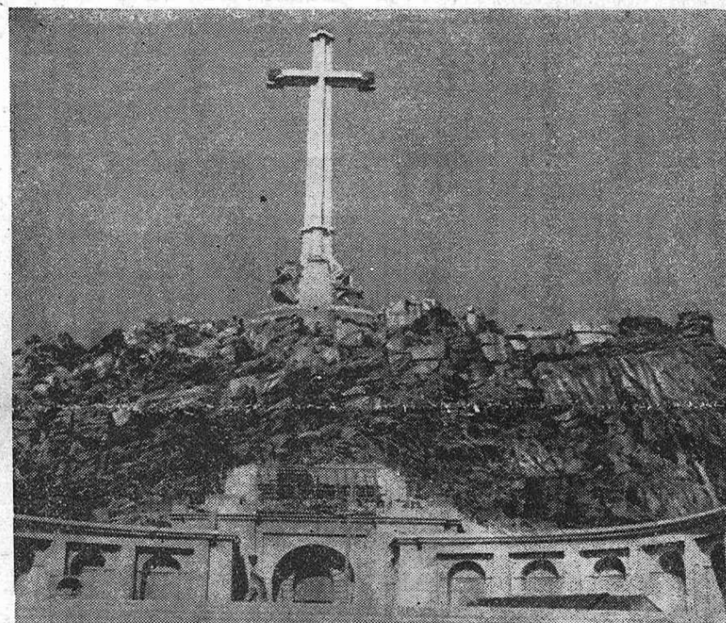
Dejando en pañales a Felipe II, en este colosal mausoleo, construido en el interior de una montaña por mano de obra forzada de prisioneros «rojos», se propone yacer el «caudillo», en medio de sus «caídos» cuando dios haga la puñetera gracia de quitármelo de en medio.