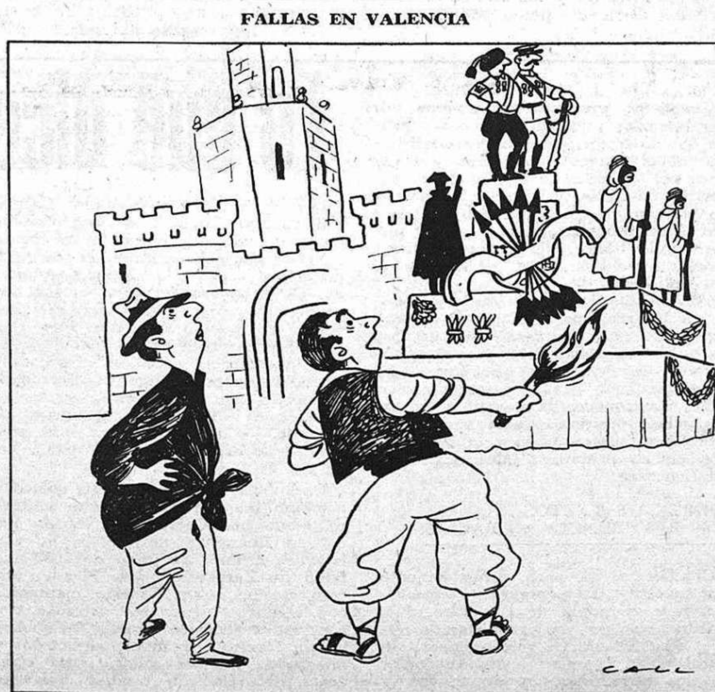
EL DIVINO IMPACIENTE. — ¡Ché, ya ardo en deseos de pegarle fuego!