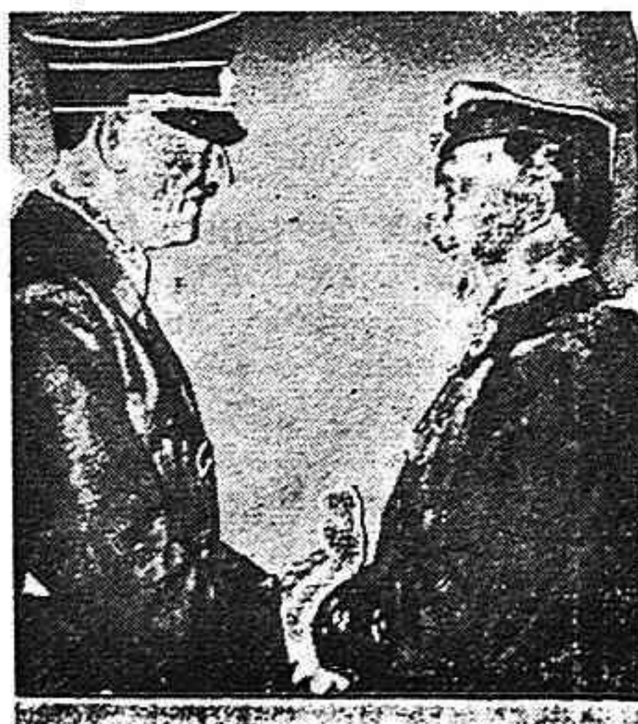
Agencia de masas en la Francia española. Hechos 23 octubre 46

Amigo lector: llene y remita su tarjeta, haga que todo partidario de la causa republicana española exprese en la misma forma sus sentimientos.