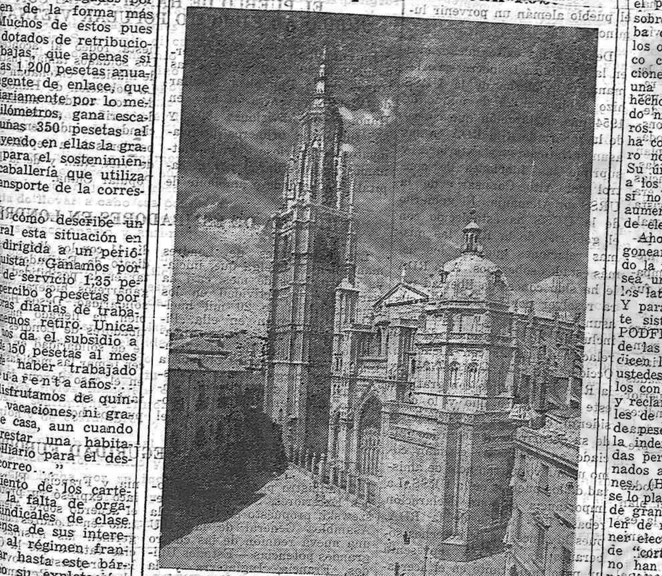
Un día del mes de octubre de 1926 se colocó la primera piedra de la catedral de Toledo, cuya edificación se debe al arzobispo Jiménez de Rada y al rey Fernando III de Castilla.

Un día del mes de octubre de 1926 se colocó la primera piedra de la catedral de Toledo, cuya edificación se debe al arzobispo Jiménez de Rada y al rey Fernando III de Castilla. Aunque se realizaron posteriores ampliaciones en los siglos siguientes: Es, sin duda alguna, una maravilla del arte gótico, y en ella dejaron la huella de su genio forjadores como Crespés y Villalpando; el maestro Rodríguez Alonso (Constructor de su torre), escultores como Berruete y pintores como el Greco.