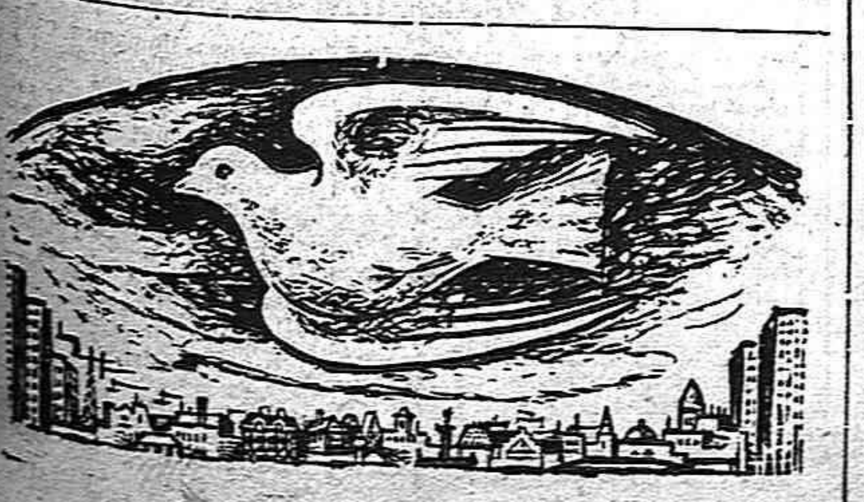
Ministerio de Cultura 2005

Las decisiones del Consejo Mundial de la Paz, reunido en Budapest, constituyen una valiosa ayuda para el pueblo español, pues al declarar que "la seguridad de los pueblos y el mantenimiento de la paz pueden ser garantizados si los pueblos imponen el respeto a su soberanía y luchan contra la ingerencia extranjera en su organización de su vida, contra la concesión de bases militares y contra toda forma de ocupación por tropas extranjeras", funde como no podía ser de otro modo, los objetivos de nuestro pueblo, que son esos mismos, con los de todos los pueblos del mundo. El pueblo español y todos los españoles que defienden la soberanía de España y luchan y lucharán cada vez con más vigor contra el imperio del imperialismo, contra la cesión de bases al imperio norteamericano y contra la ocupación de nuestro territorio por fuerzas militares extranjeras; este es el camino para salvar a nuestra patria de los graves peligros de guerra que la amenazan y para reconquistar la independencia nacional.