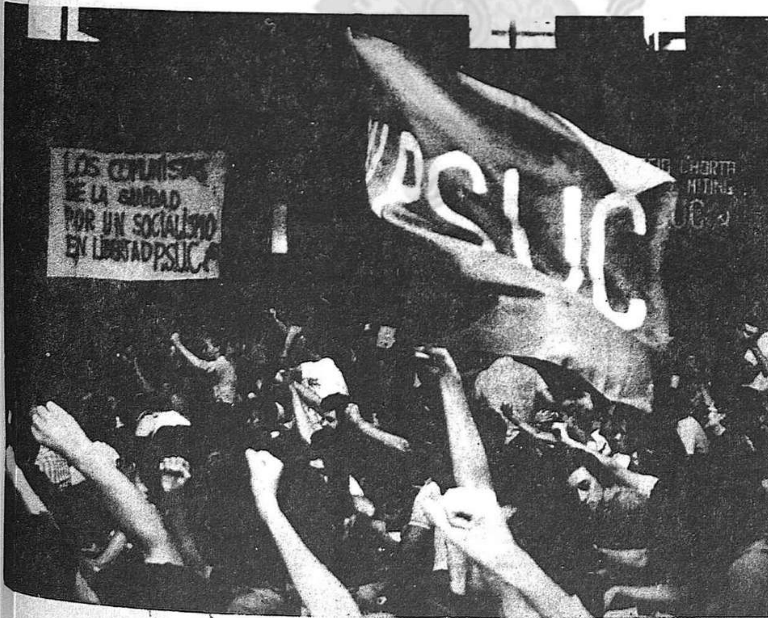
Míting del 40 aniversari a Horta

Aquesta activitat està multiplicant els vincles del Partit amb les masses i prepara les condicions per a una intensificació del reclutament. Cada organització ha de plantejar-se ara molt seriósament aquest objectiu.