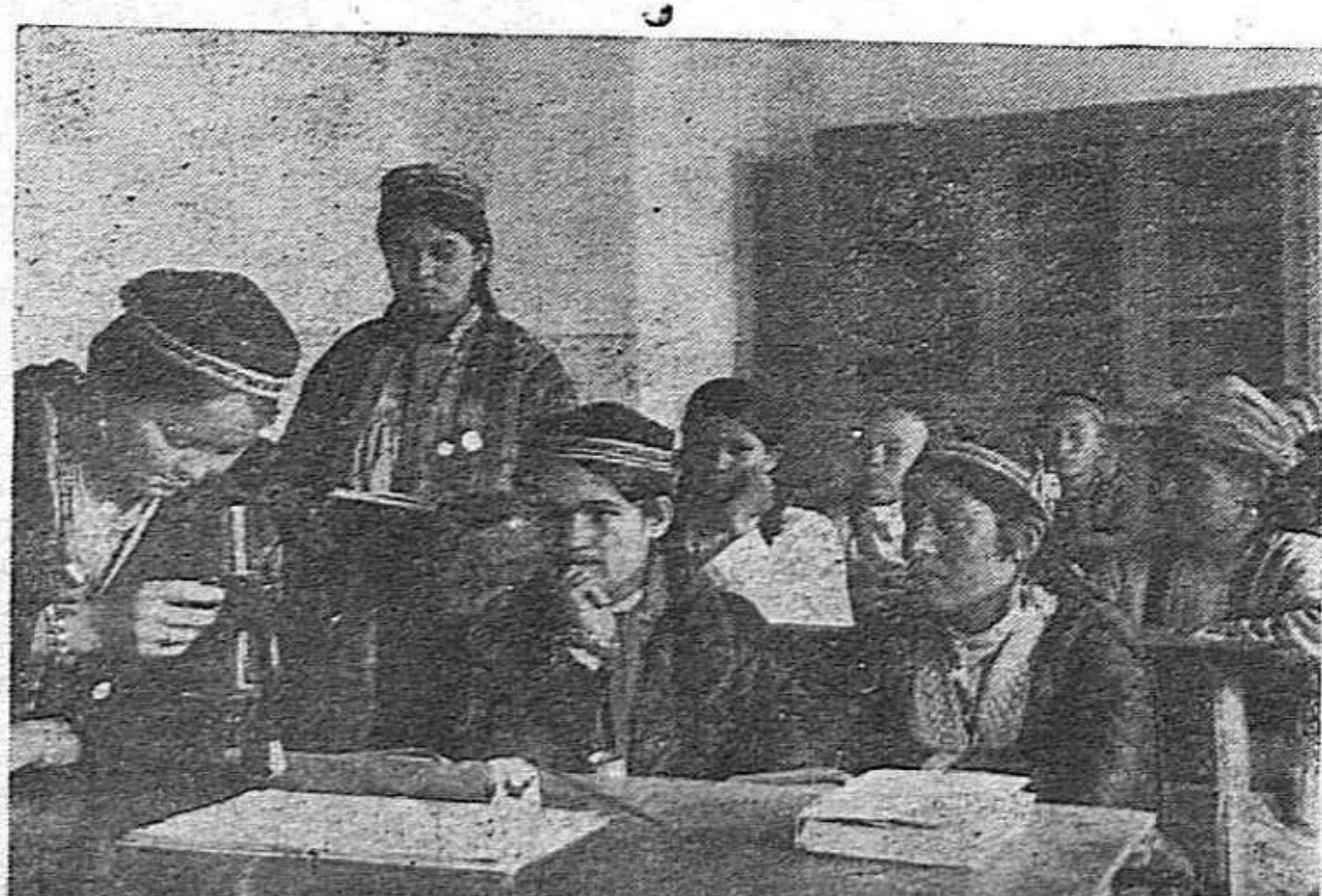
El Quinto Plan Quinquenal de la URSS presta una atención de primer orden al desarrollo de todos los aspectos de la educación y la cultura. En la foto: en un koljós situado en el corazón de la Turkmenia soviética (Asia Central), los koljósianos aprenden a utilizar el microscopio.

Es de destacar en esta gran acción desarrollada ante el Consulado franquista que los republicanos españoles en Nueva York establecieron una cordial unidad mediante conversaciones previas entre el Comité Coordinador y las Sociedades Hispánicas Confederadas.