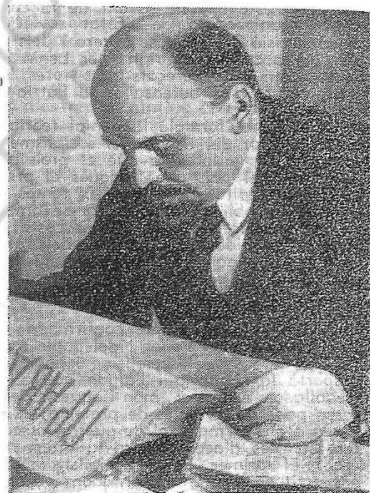
Vladimir Iltx LENIN

amb la Unió Soviètica, un testimoni viu i palpable del que ha estat i representa el fet que la classe obrera en aliança amb la pagesia prengué el poder polític en les seves mans amb el fi de construir una nova vida pel camí del socialisme, avançant cap al comunisme. Davant d'ells apareix cada dia més clar com llur germans de classe han transformat un país immens, que era abans la Rússia tsarista, autocràtic, imperialista i presó de pobles, en un Estat de tipus nou, socialista, creat d'acord amb els interessos del poble, amb una economia industrial-agrària en ascens constant i harmònic, que s'ha elevat ja al segon lloc de tots els països del món pel volum de la seva producció industrial, concepte pel qual no era més que el cinquè