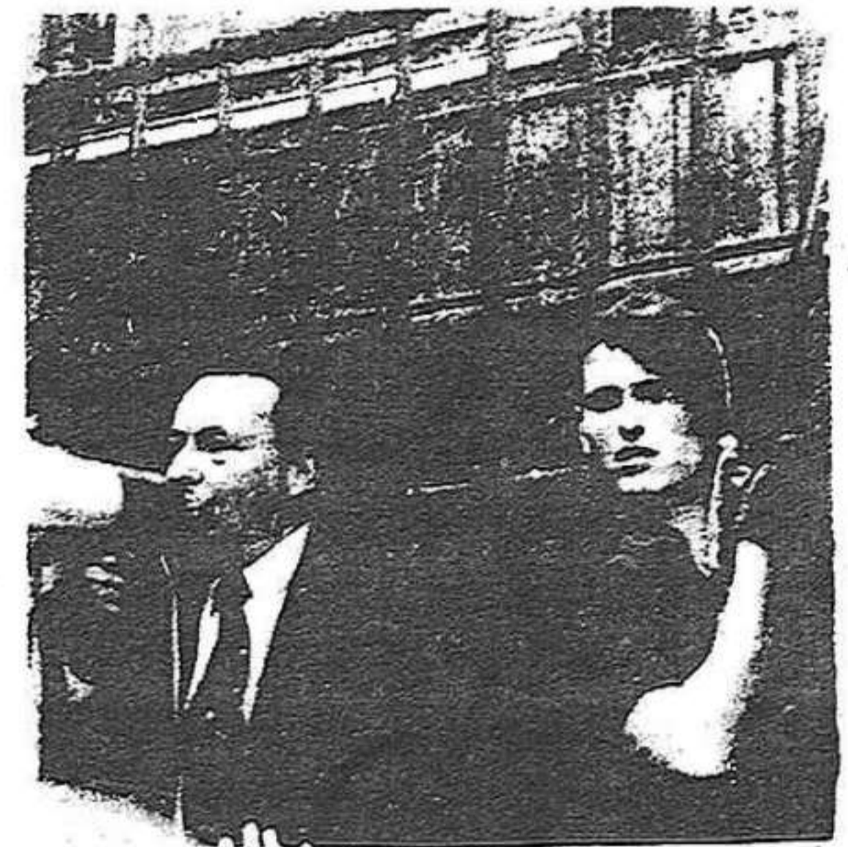
L'estratègia de la tensió. Aquest cop a Catalunya.

de Madrid, n'hauria de prendre nota. No fos cas que la teoria del "ajuste de cuentas" que ha fet servir per "explicar" la massacre d'Atocha pogués ser utilitzada demà per explicar també d'altres episodis dramàtics de