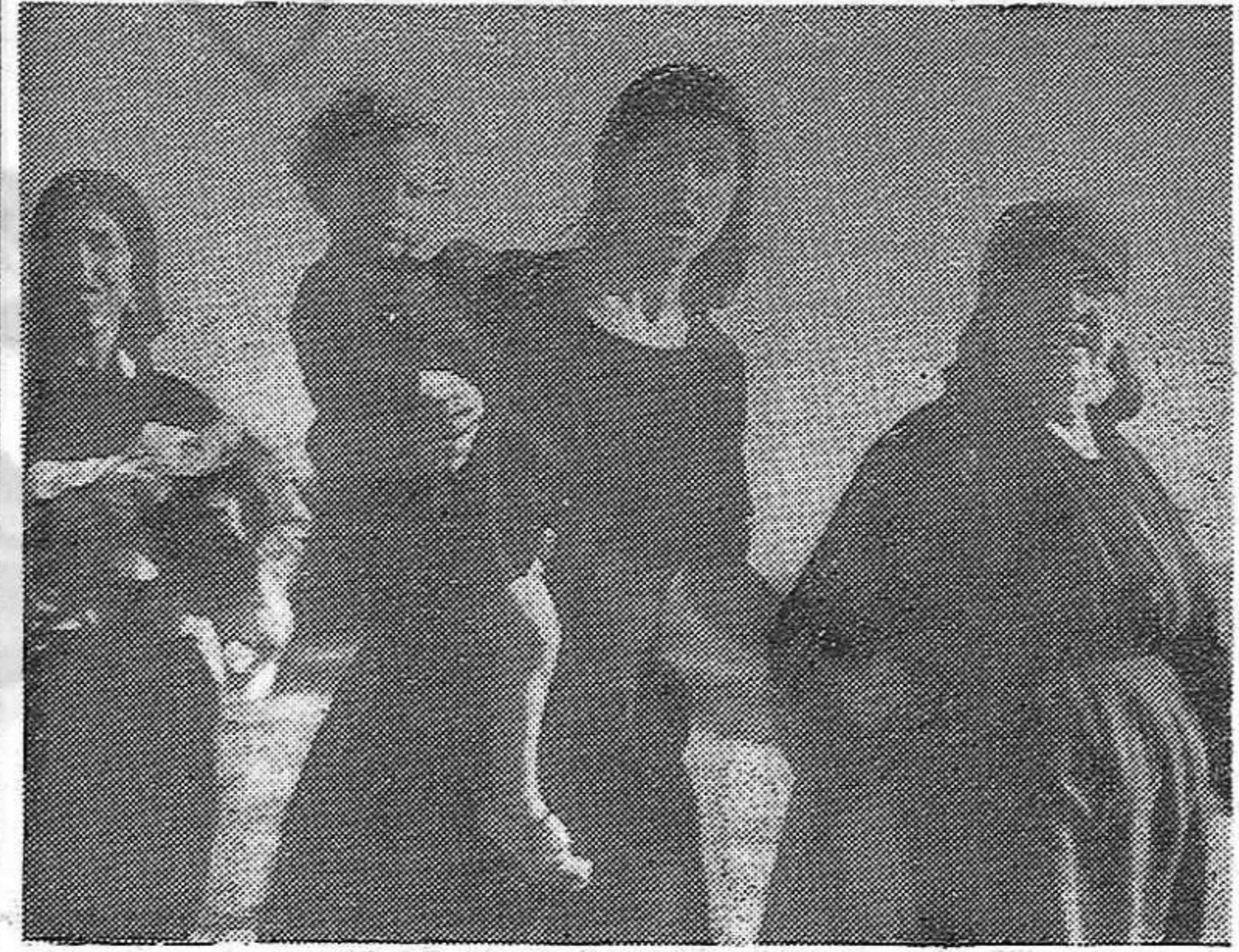
Asi es la Espana de Franco. Caras de dolor y cuadros de espanto. Las palabras de Dolores, « Franco ha hecho de España una inmensa cárcel », encuentran su confirmación tragica cada día, en los execrables y continuos crímenes del franquismo.

Después de la reducción de la ración de pan a 150 gramos, su calidad es aun peor que anteriormente. Mezcla de centeno, maíz y cebada, practicamente es incomedible.