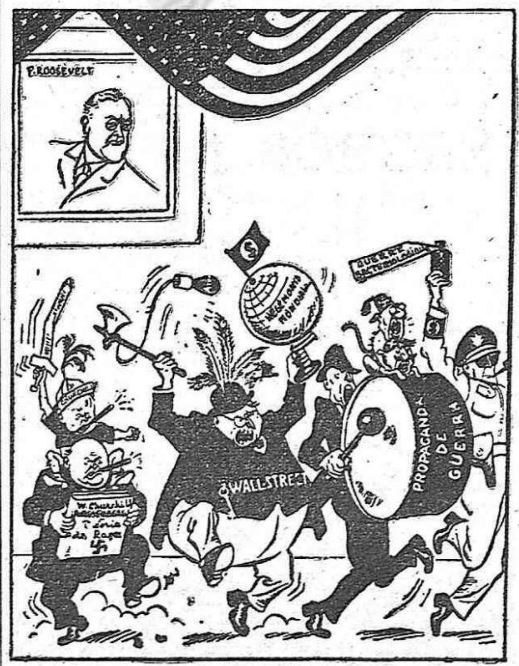
La danza de guerra de los « atómicos » Roosevelt: « ¿Donde conducen América? ». (Dibujo de Boris Efimov)

¿No es claro esto para todos los democratas españoles y no significa así una gran ayuda para nuestra causa la Declaración de los partidos comunistas? Ello nos debe enseñar que el supeditar, el condicionar la liberación de nuestro pueblo a la voluntad y a los propósitos de las potencias imperialistas, si se hace de buena fé, es un error. Pero conscientemente, es una traición. Estas potencias solo desean explotar y dominar nuestro país para su lucro. Podemos impedir su designio, podemos incluso forzar su oposición a la liquidación del franquismo, pero ello solo sera por el camino de nuestra lucha, de nuestra unidad, con la solidaridad de las democracias auténticas y los pueblos del mundo.