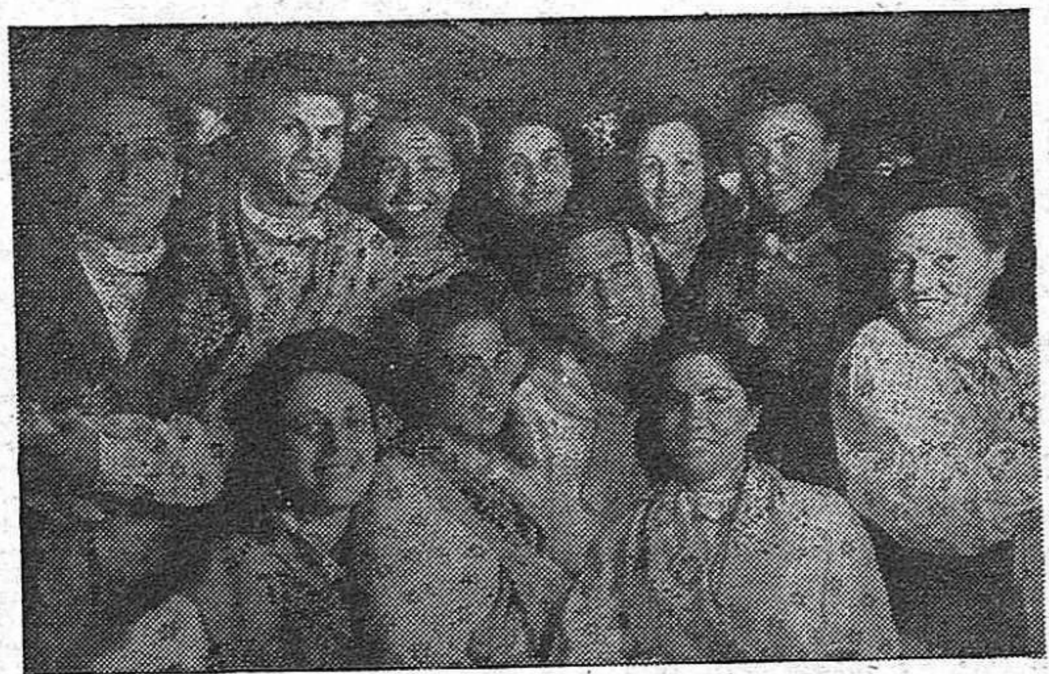
Grupo de muchachas, vascas en su mayoría, estudiantas y obreras, que en la Union Sovietica se entregan con entusiasmo a su trabajo y a su estudio, capacitándose para poner el día de mañana todo su saber a disposición de la reconstrucción democrática de España, a la que no han olvidado a pesar del tiempo y de la distancia.

(Santiago CARRILLO, en su magnífica Conferencia, « 10 años en la Union Sovietica », ponía de relieve la enorme esperanza que suponen para el mañana esos centenares de jóvenes forjados bajo la soledad y el cariño del Estado y el pueblo soviéticos. Ver nuestra reseña de cuarta página.)