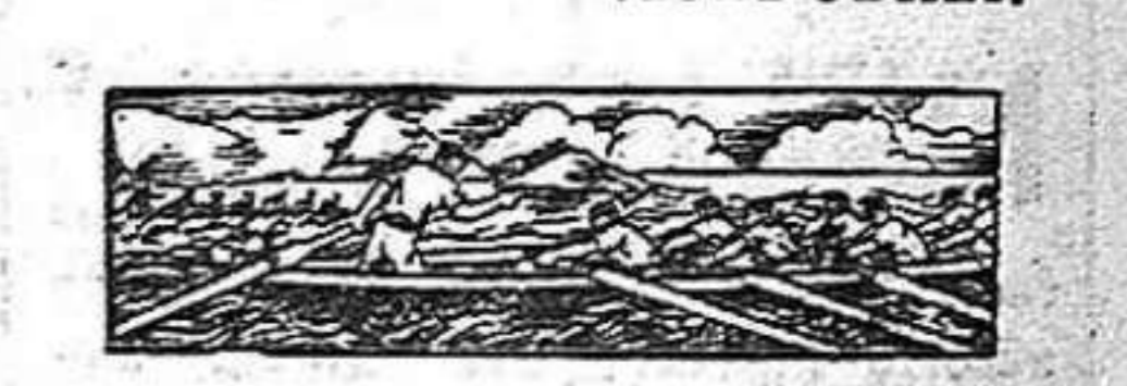
En nuestro próximo numero comenzaremos la encuesta de « Euzkadi Roja ».