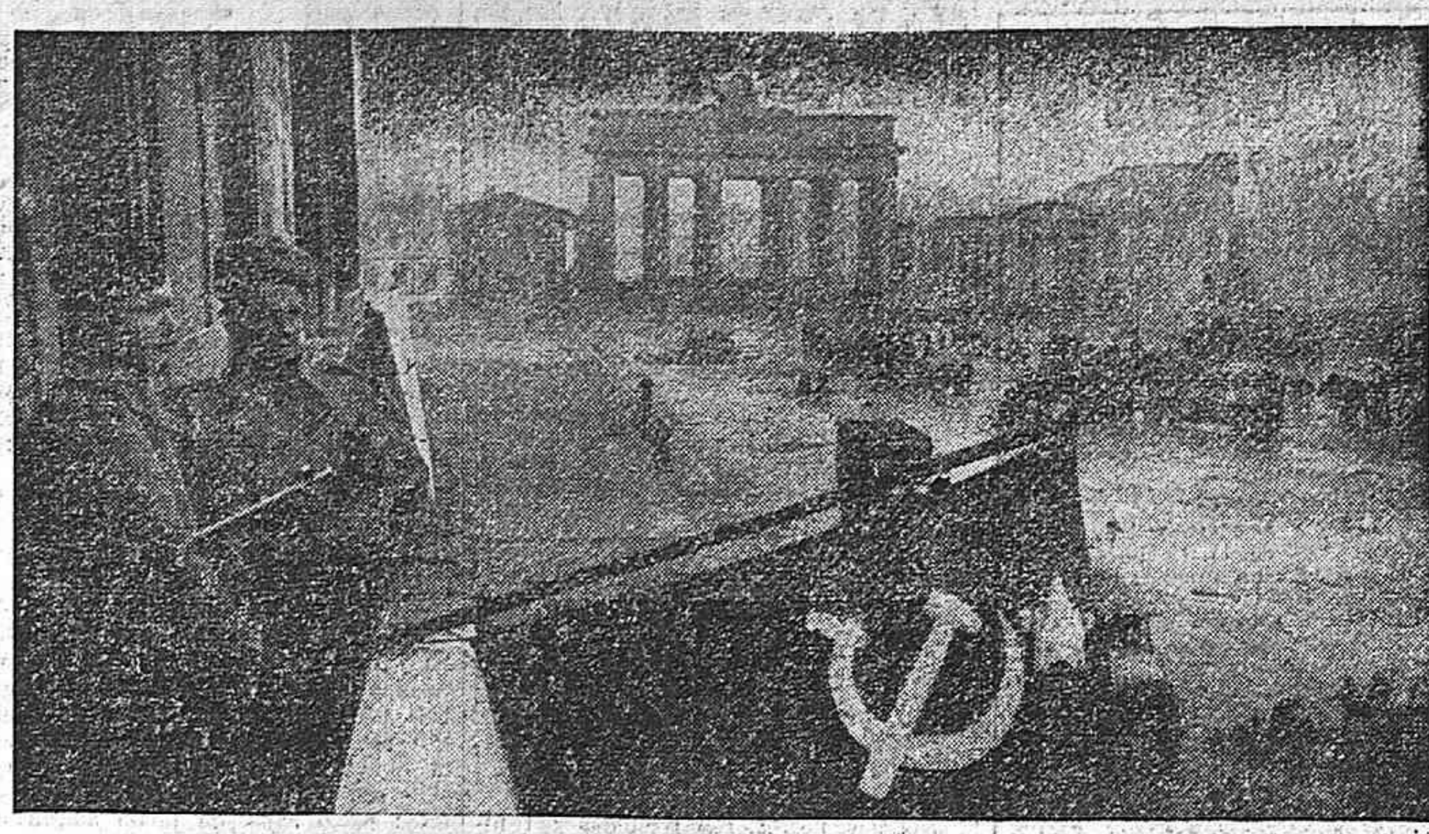
Dos combatientes del Ejército soviético plantan la bandera victoriosa en un edificio de Berlín próximo a la Puerta de Brandeburgo.