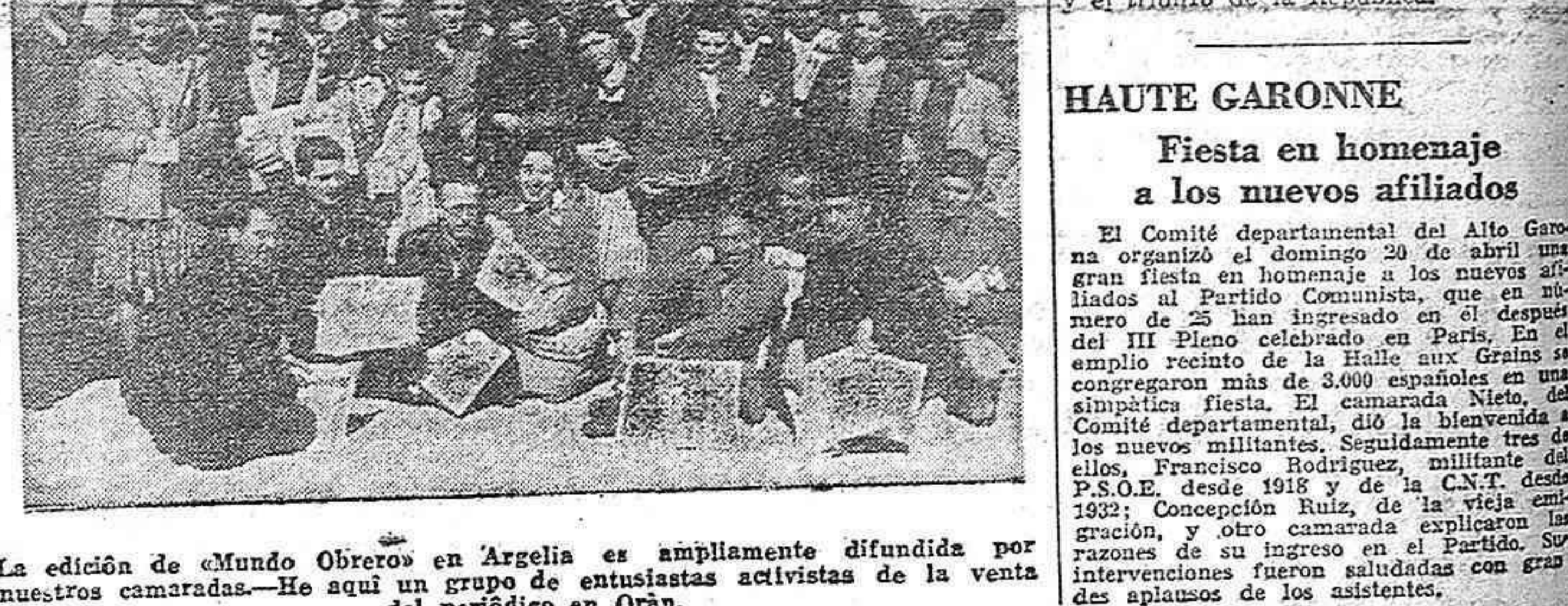
La edición de «Mundo Obrero» en Argelia es ampliamente difundida por nuestros camaradas.—He aquí un grupo de entusiastas activistas de la venta del periódico en Orán.