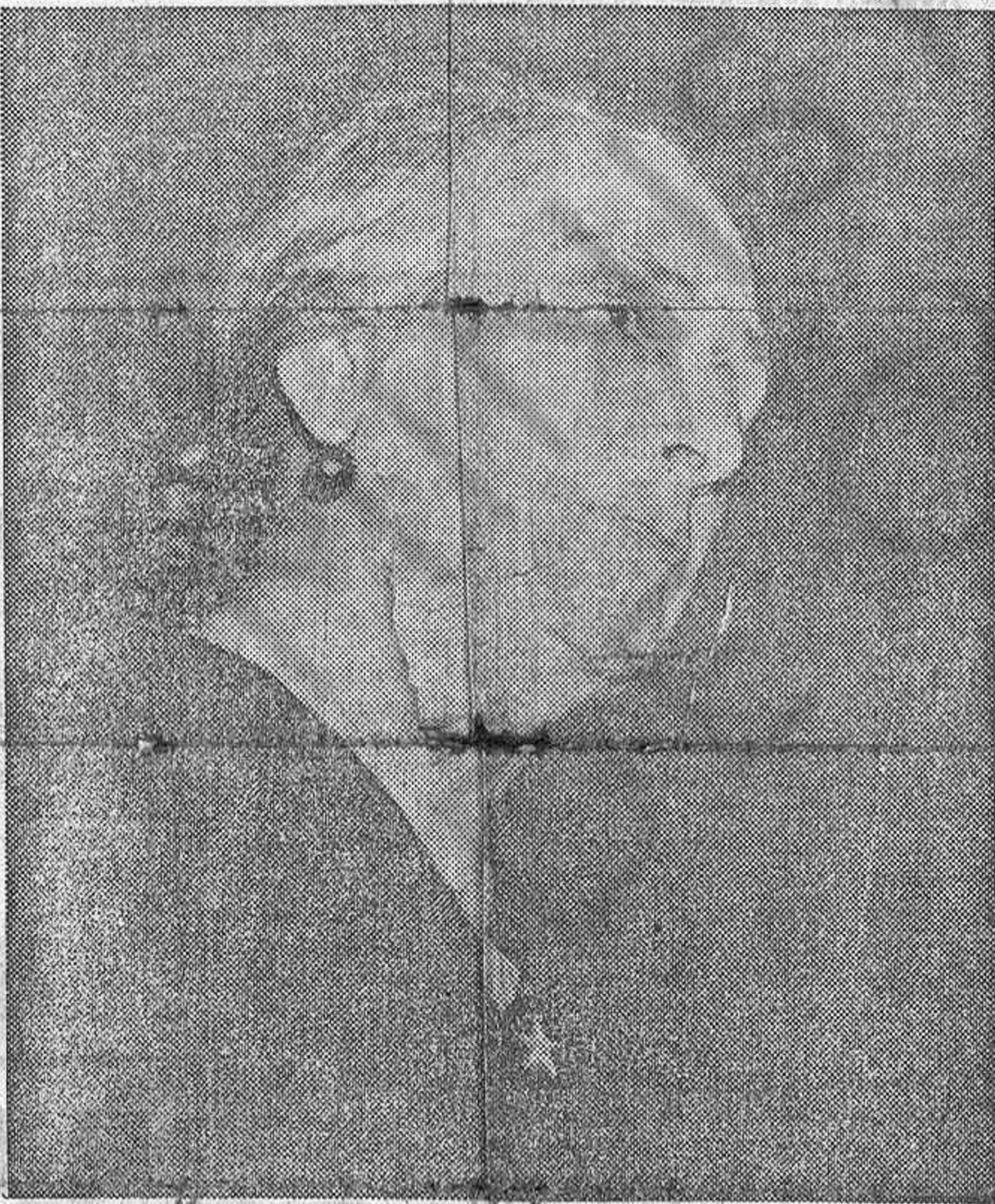
La camarada Dolores Ibarruri, Secretaria general del P. C. de España