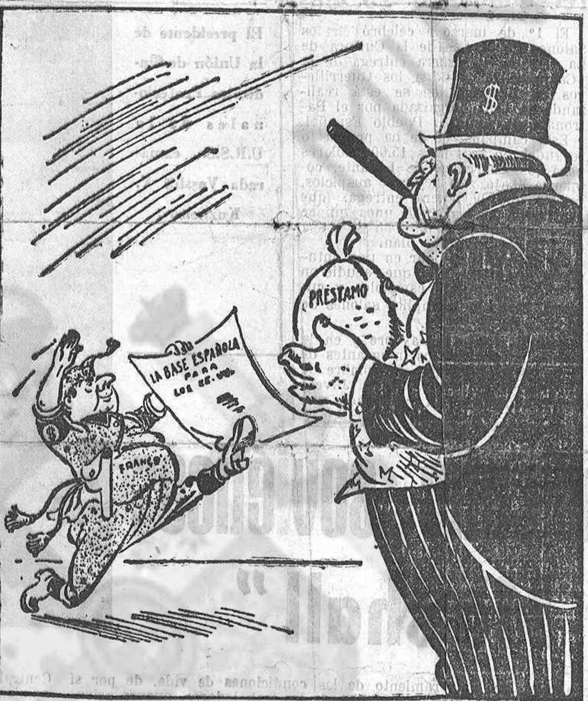
A CAMBIO (cartoon published in 'Mundo Obrero').

Ha fallecido en un pueblo de la provincia de Cáceres, un cabo de la Guardia Civil. Se da la circunstancia de que este cabo había participado recientemente en operaciones contra los guerrilleros en la provincia de Badajoz, por lo cual se supone que, aunque los franquistas lo han ocultado, había sido herido en el curso de dichas operaciones y que ha muerto a consecuencia de las heridas recibidas.