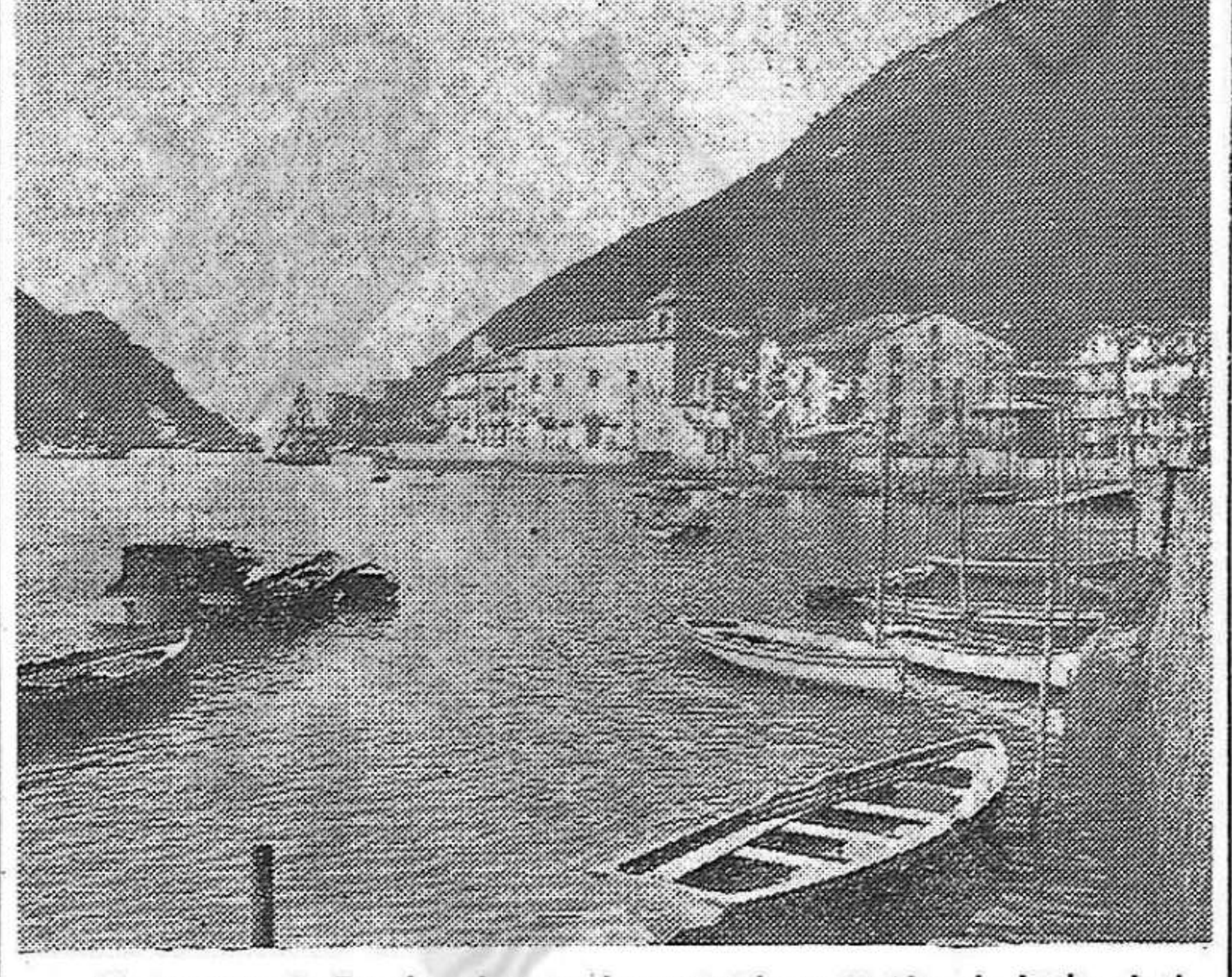
El nombre de Pasaia siempre ha evocado recuerdos de lucha de la clase obrera, de acciones en defensa de la libertad amenazada. Hoy, al recuerdo de este simpático puerto vasco se une la idea de sus pescadores en lucha, de sus obreros que aun no hacen mucho tiempo ganaban unidos batallas reivindicativas contra el franquismo.

Un Partido así, capaz de cumplir esta misión histórica para con nuestra clase trabajadora y para con todo nuestro pueblo tiene que trabajar colectivamente, en un todo monolítico, y no de una manera mecánica, caciquil o de grupo. Otro de los grandes problemas para nuestro Partido, es el de forjar muchos cuadros, capaces de cubrir en forma de nuestro trabajo, las enormes pérdidas sufridas por nuestro Partido en la lucha armada en los frentes, y en su continuación en el combate clandestino.