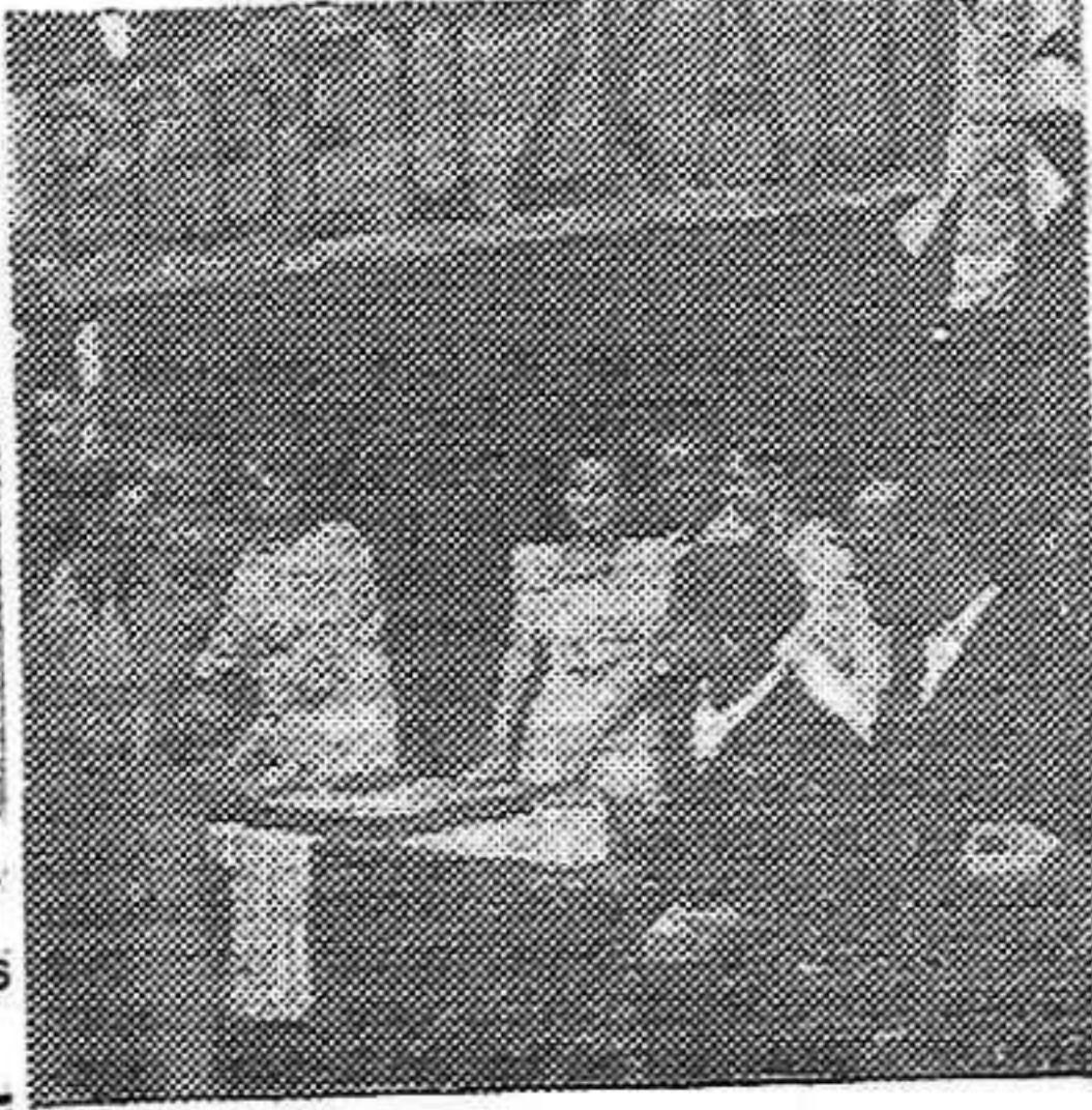
Una fiesta de nuestros camaradas de Orleans

El 12 de este mes estallo una bomba en el palacio de dicho falangista en el Paseo de Gracia, ocasionando importantes destrozos. Los guerrilleros saben castigar a los estraperlistas y a los ladrones de Falange.