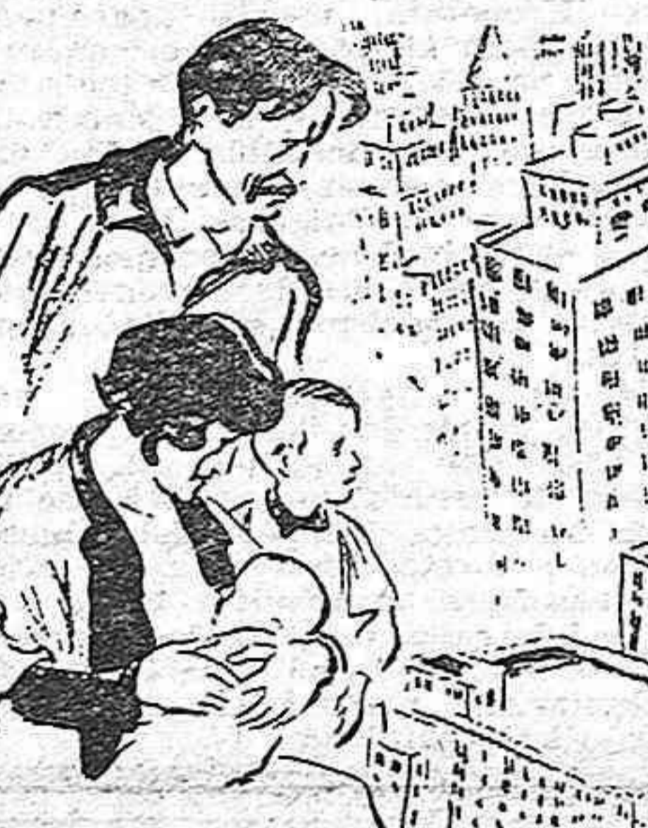
... y su grandísima miseria.

elementales libertades cívicas estén garantizadas. Y se ha achacado a una supuesta campaña, puesta en juego por malos consejeros, nuestro afán por abrir cauce a una legalidad en que las opiniones sean respetadas. Se ha pretendido y se pretende, por parte de las « plumas compradas », que decida el Francisco de Quevedo de los servidores del despotismo de su época, presentar a los estudiantes con vergüenza, con dignidad y con hombría, como elementos levantiscos y fácilmente influenciados por doctrinas de importación extranjera.