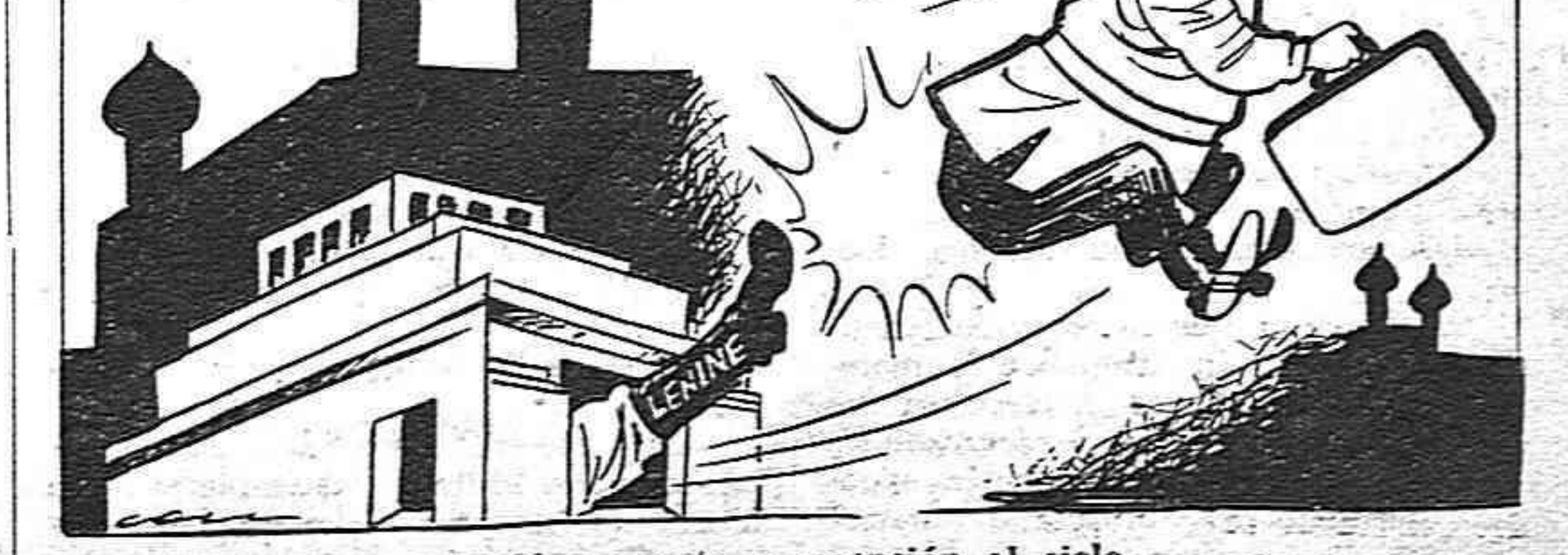
Pasión, muerte y ascensión al cielo.

En resumen, si las monarquías son garantía de paz, los carlistas por lo menos siempre han sido guerras de todo lo contrario. Tres guerras civiles en cien años lo han probado suficientemente.