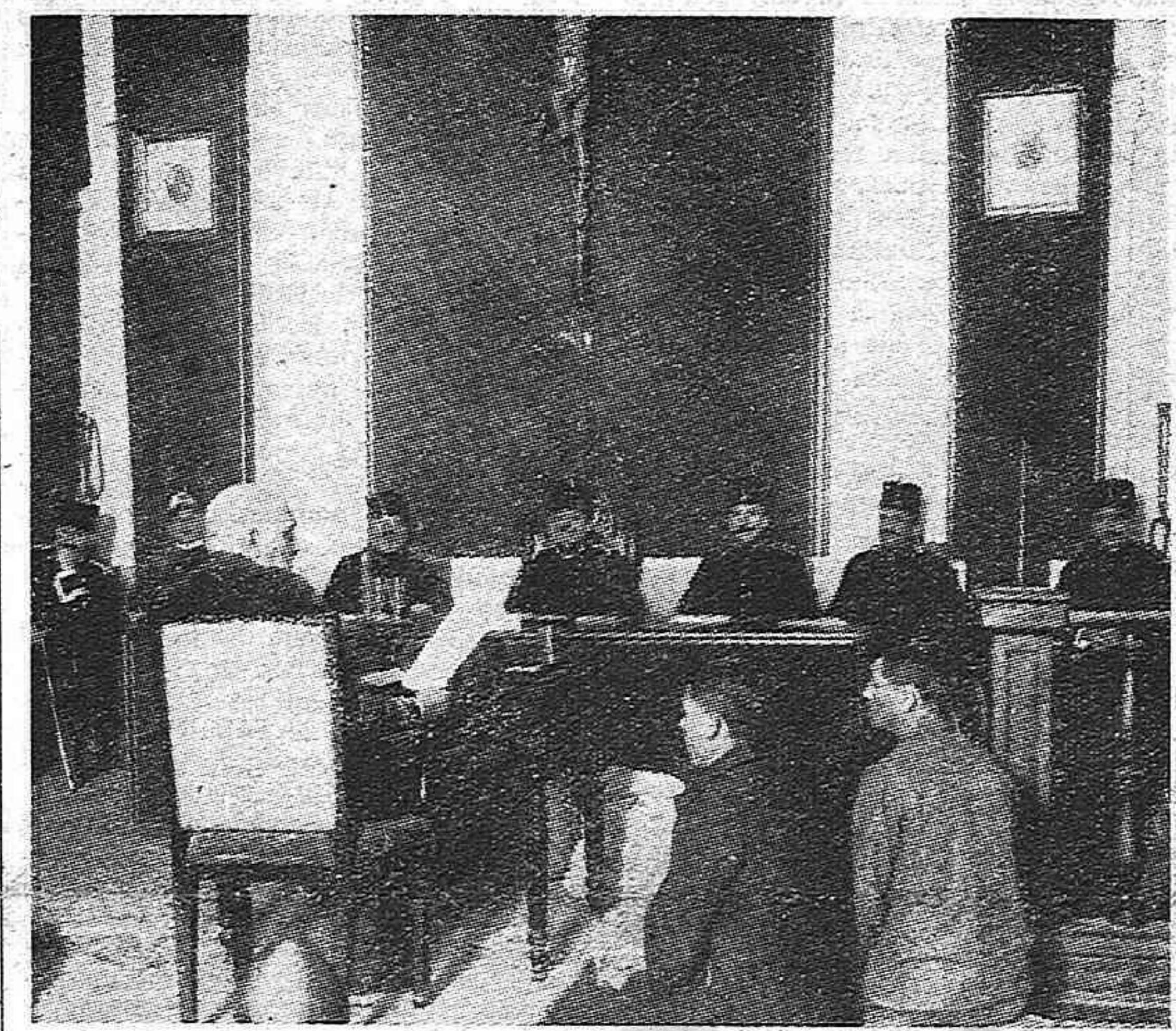
Esta foto corresponde al Consejo de Guerra celebrado en otoño de 1908 en Sevilla contra dos presos que conducidos en tren por la Guardia civil hacia el lugar de su condena...