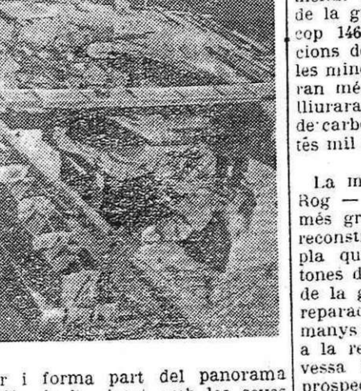
Heus acut un aspecte dels treballs de reconstrucció de la presa del Nieproderjinsk, destruïda durant la guerra.