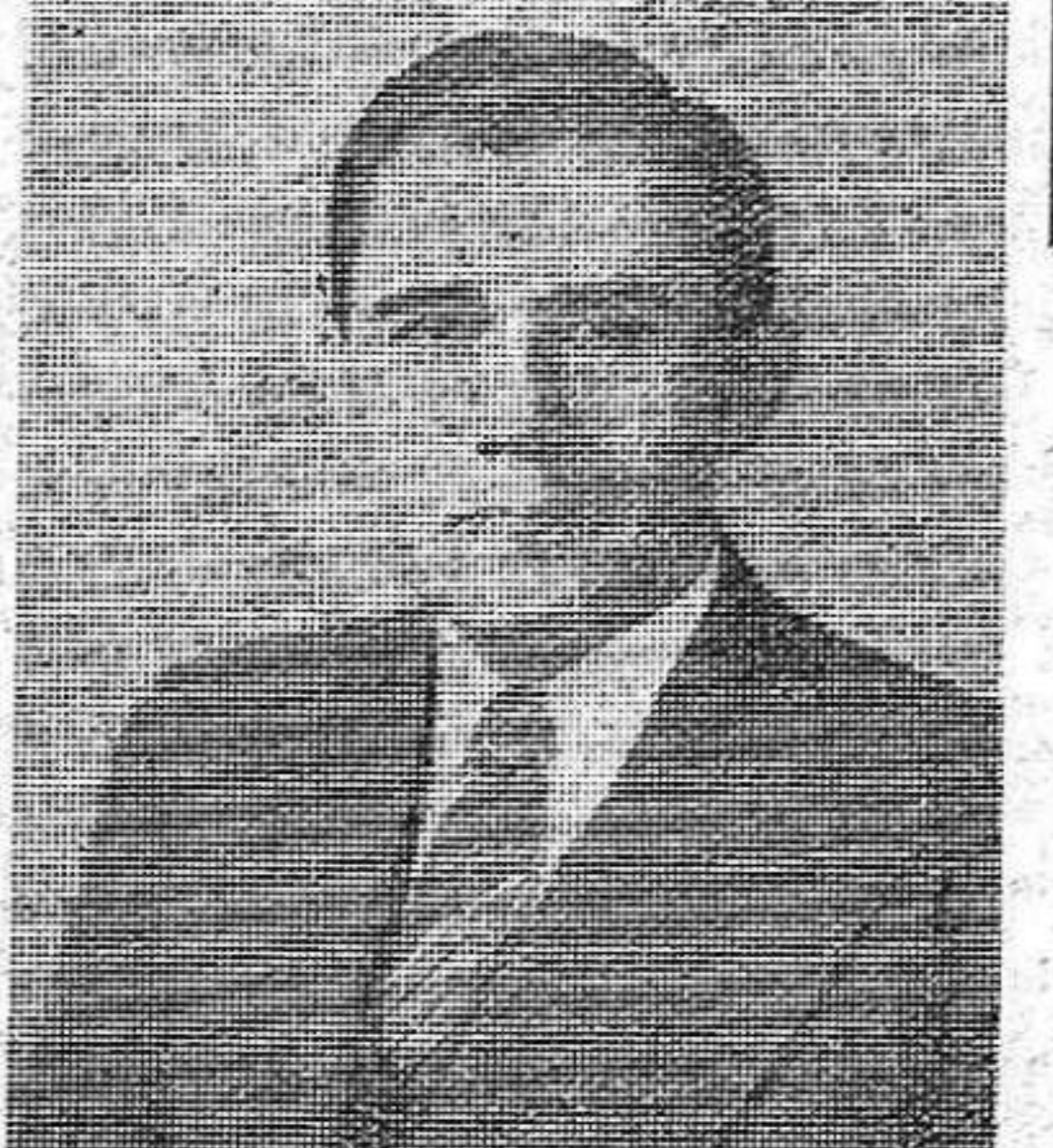
ANDREI A. GROMYKO, Embajador de la U.R.S.S. en los Estados Unidos y Delegado permanente en el Consejo de Seguridad, que ha puesto al descubierto en una vigorosa intervención la ayuda de los imperialistas al mantenimiento de Franco.

El reconocimiento de los demócratas españoles ira una vez más hacia sus verdaderos amigos: La Unión Soviética,