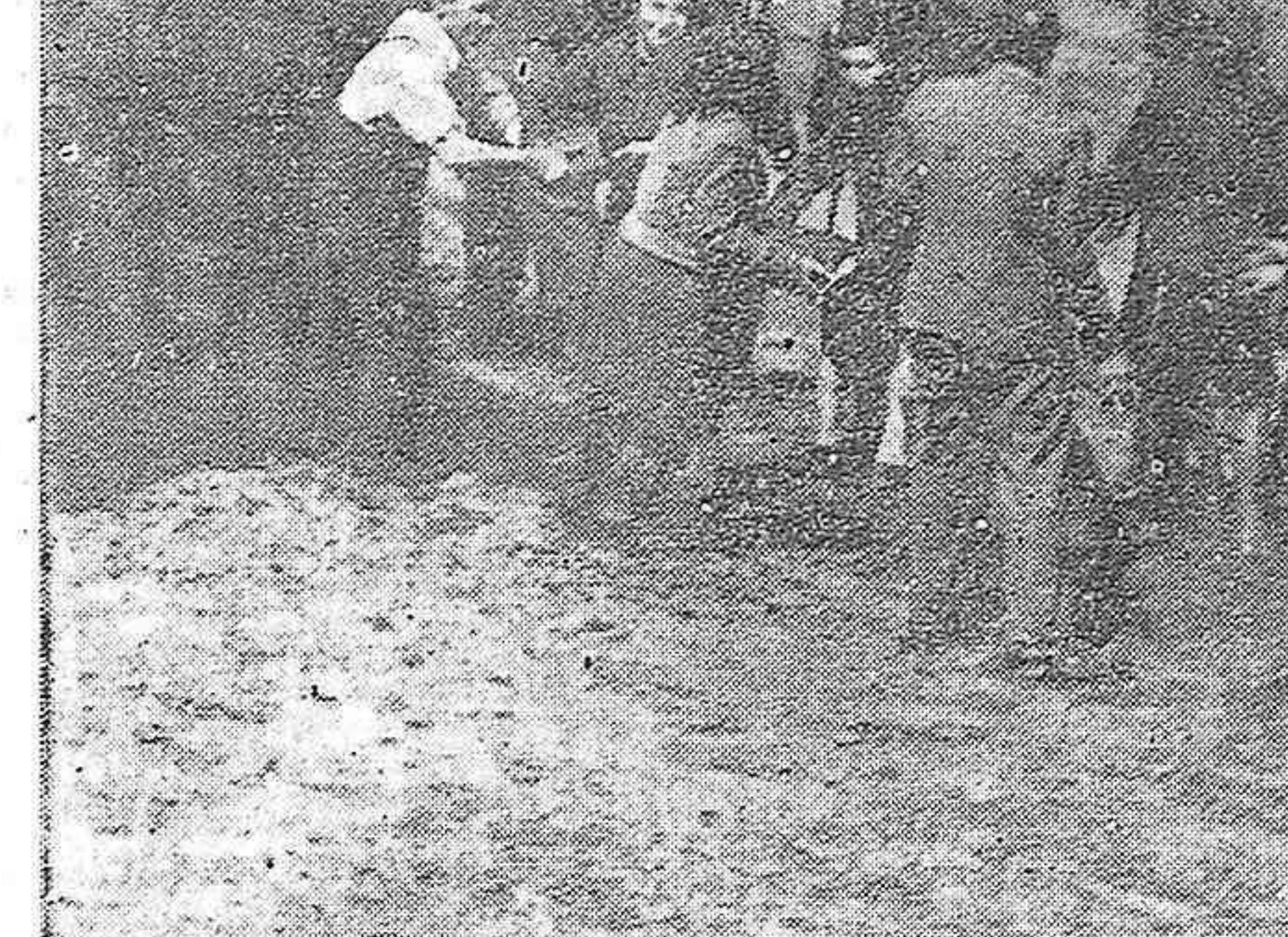
El pueblo checoslovaco, que expresó el domingo su voluntad democratica, contribuyó activamente con su lucha a la liberación de su patria. He aquí los vecinos de una barriada de Praga levantando una barricada.

Los comunistas españoles saludamos a los democraticos checos, y muy particularmente al Partido Comunista, al Partido que en su reciente Congreso acogio con cariño y aclamaciones a nuestros camaradas Anton y Lister, a los comunistas checos, que exclamaban: 'Cuidados a Dolores, porque Dolores tambien es nuestra'. Estamos convencidos que con este triunfo la simpatia y ayuda que siempre demostró el pueblo checoslovaco por la causa de la libertad de España va a ser incrementada y constituirá una aportacion cada vez mas valiosa a nuestro pueblo en su lucha por la libertad e independencia.