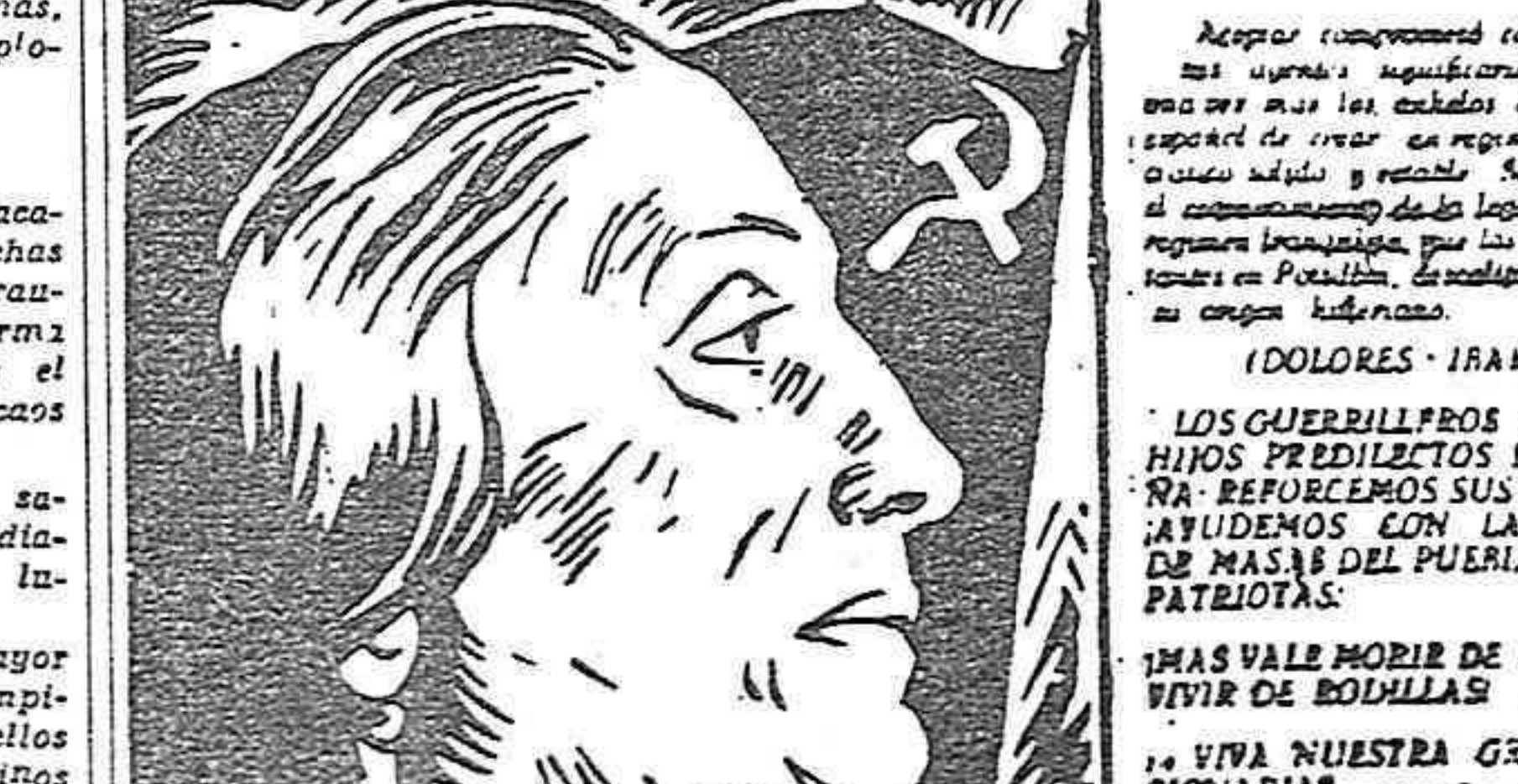
(DOLORES IBARRURI) SECRETARIO GENERAL DEL PARTIDO COMUNISTA

¡RECORDEMOS QUE FRANCO NO ES MAS QUE UN PUNTO DE PUNTO! ¡RECORDEMOS QUE FRANCO NO ES MAS QUE UN PUNTO DE PUNTO!