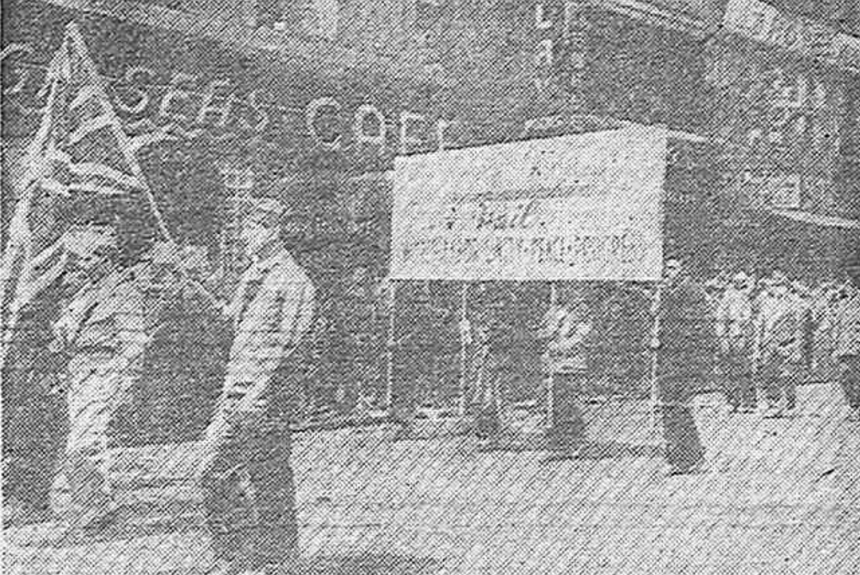
Nueva York.—El Comité de Unidad del Primero de Mayo organizó la más grandiosa manifestación que se ha conocido en la ciudad. En ella desfilaron Los Amigos de la España Republicana en lugar preeminente. A su cabeza, portadores de banderas españolas, iban los veteranos de la Brigada Abraham Lincoln.

He aquí, creo, precisados los puntos positivos y negativos de esta reunión del Comité. Esperamos que la Federación Sindical Mundial hará algo mejor y que por fin el Gobierno laborista inglés, que interviene en favor de Franco por razones que no tienen nada que ver con los intereses de la clase obrera, cesará de hacerlo, ya que Franco constituye un foco amenazador para la paz.