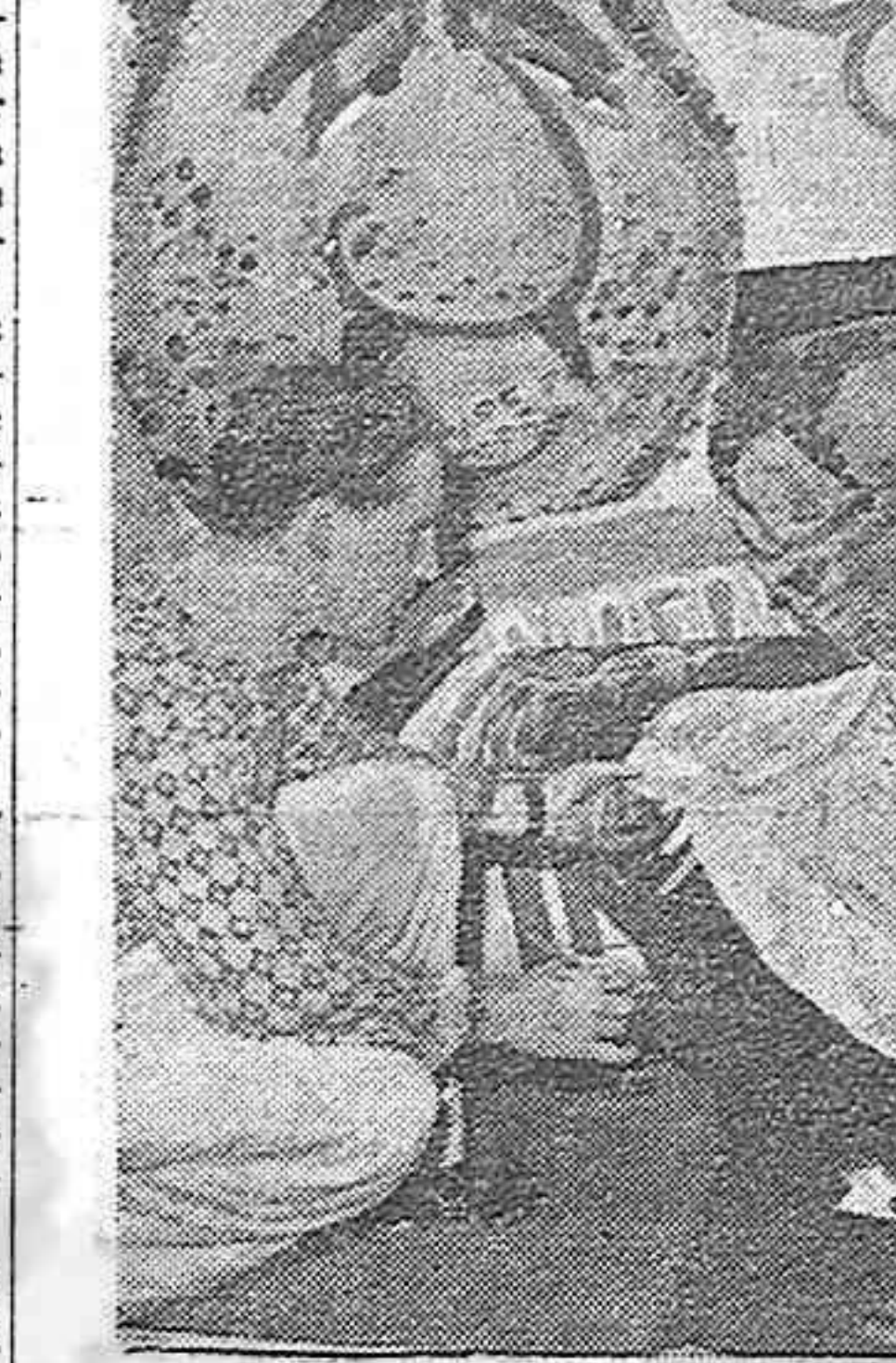
Copenhague.—El taller donde se prepararon algunas de las pancartas y caricaturas para la gran manifestación antifranquista del 14 de abril, a la que asistieron 150.000 personas.

Para ayuda a la lucha del pueblo español Un grupo de españoles residentes en Ginebra (Suiza) nos ha remitido la cantidad de 2.000 francos para ayuda a la lucha del pueblo español. Inspiradas en el ejemplo de las heroicas mujeres españolas que en 1909 luchaban en la huelga de Madrid, de las que participaron en la huelga general revolucionaria de 1917 y en la