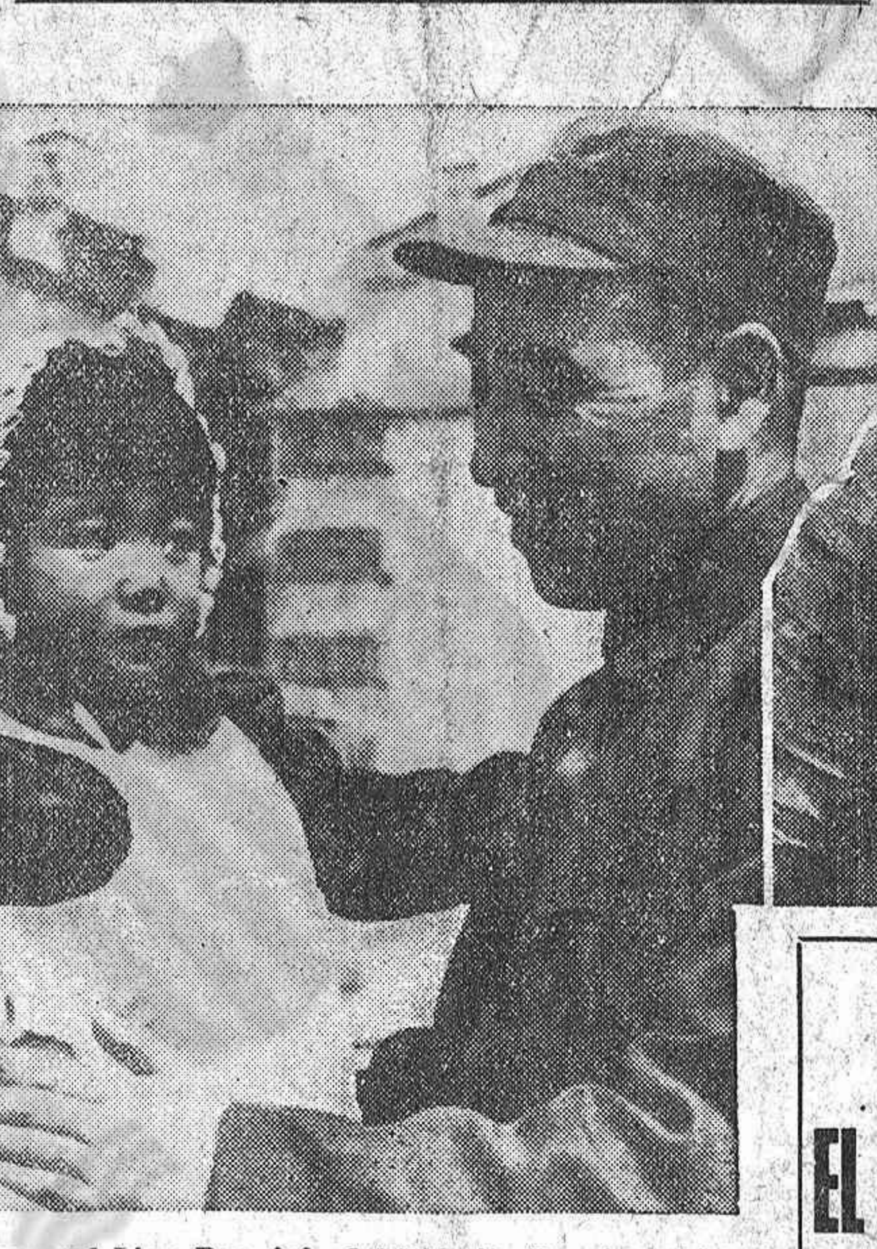
El general Ling-Pao, jefe del Ejército Popular chino de Manchuria, con su hija. En la foto de arriba: Una campesina combatiente