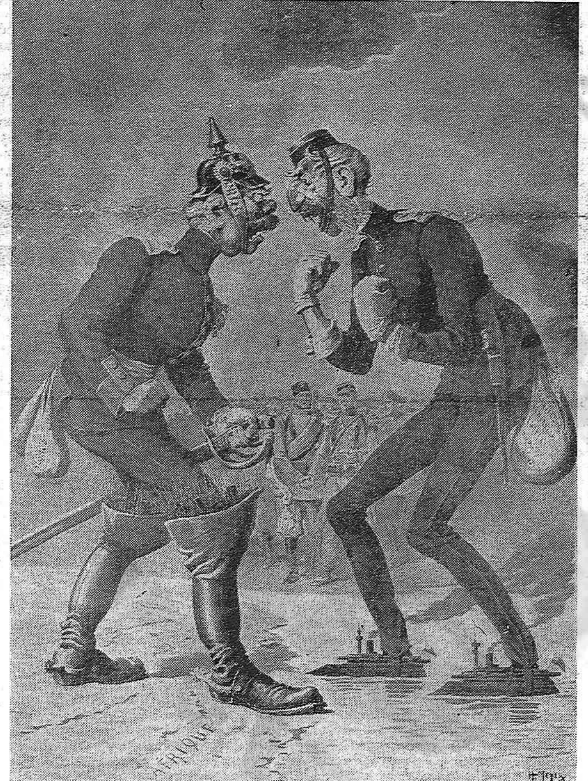
He aquí los representantes de los dos bloques—inglés y alemán—que se repartieron el dominio del mundo desde últimos del siglo pasado hasta principios del presente.

hombre, el ciudadano, el militante de cualquier raza, partido o nacionalidad. Lo importante, sin embargo, es constatar cómo reaccionan estos elementos movidos por el escorzo del feudalismo que les cupo en suerte. La regla general perceptible da como resultado una incapacidad supina para la iniciativa propia. Los pueblos todavía coloniales no encuentran a mano otra alternativa que optar entre dos señores. Las masas laboriosas organizadas de «nuestro mundo» se reparten entre los polos de atracción prefabricados. Los reformistas de las organizaciones autónomas todavía indemnes, feroz y dignamente revolucionarias, trabajan intensivamente para desalojar al sindicalismo heroico de su último baluarte. No necesitamos argumentar más extensamente el por qué de nuestro tesón, de nuestra firmeza, de nuestra consecuencia frente y contra la avalancha liberticida encarnada en las concentraciones de poderes, mitad impuestas y mitad consentidas.