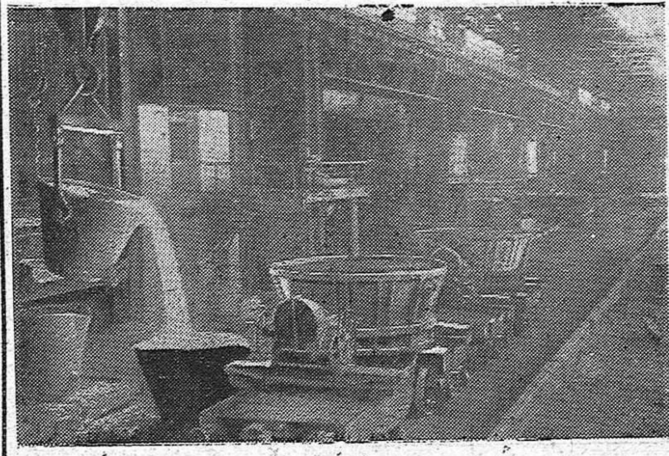
Los talleres de fundición han sido testigos de innumerables acciones de lucha de la clase obrera. En estos mismos talleres y en otros, los obreros vascos preparan nuevas luchas por mejores racionamientos y por mayores salarios. Luchas políticas contra el franquismo, por la democracia y por la República.

20.000 obreros en huelga en 37 acciones combativas durante los seis últimos meses del año. Este es el balance con que la clase obrera vasca (pasa a la 3 página)