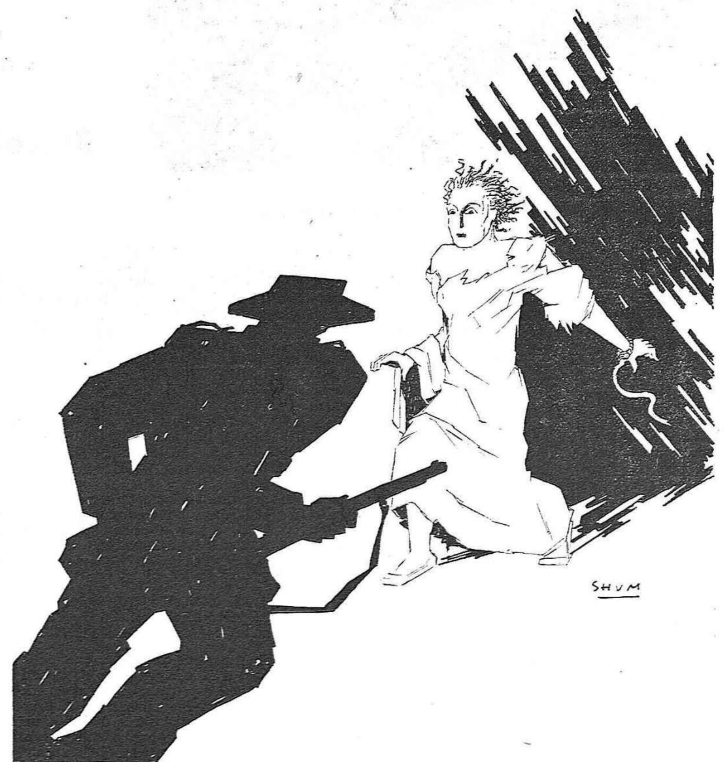
Ha acabat la guerra. Comença la « pau »...