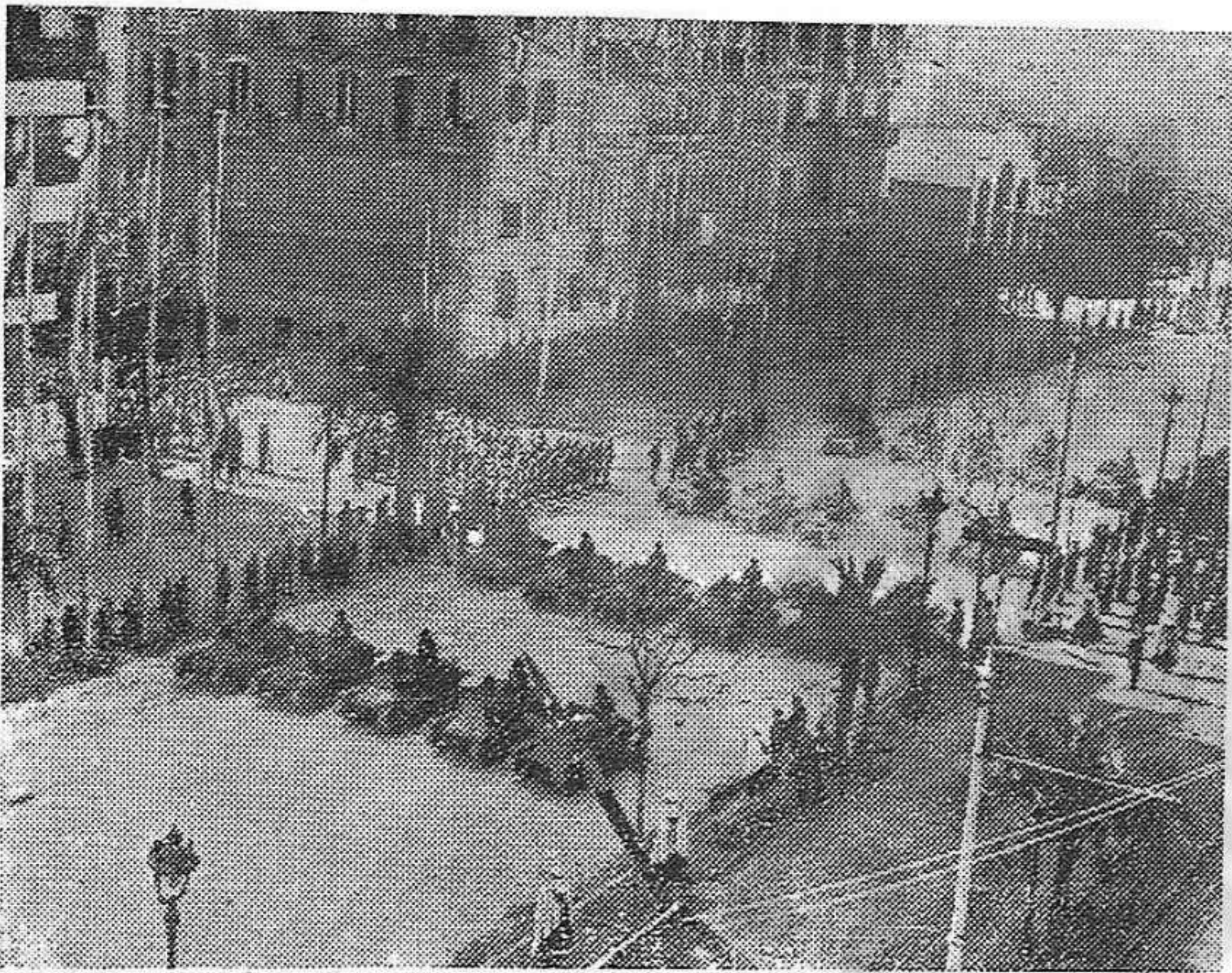
Com es veu, el poble barceloní no hi és...